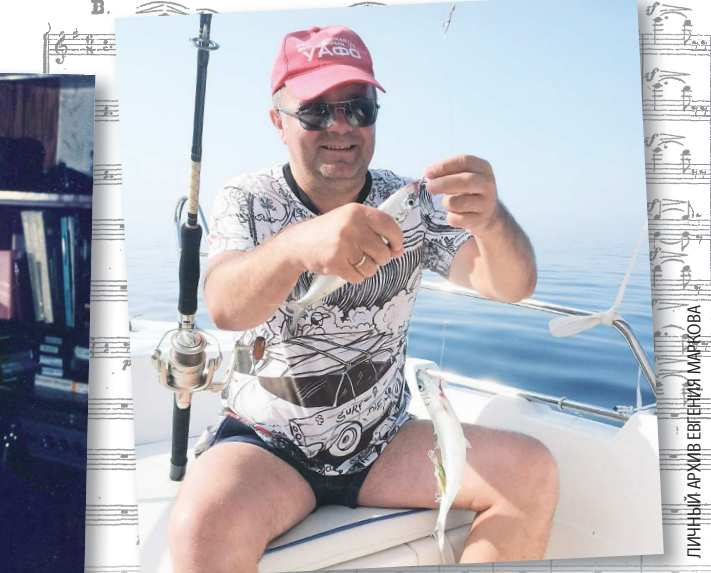
Отпуск. Адриатическое море. И собственноручно пойманная ставрида