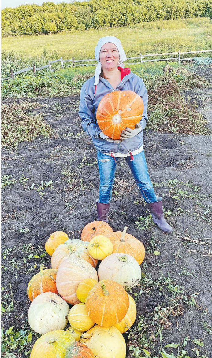
Тыквы необходимо собирать созревшими, иначе они не будут храниться

Огурцы, перцы, томаты, баклажаны на Среднем Урале по большей части выращивают в теплицах. Но и в открытии, если там нет отопления, уже пора собирать весь урожай.