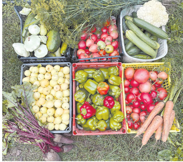
Овощи и ранние яблоки лучше всего снимать до первых заморозков

Огурцы прекращают формировать завязи уже при тем-