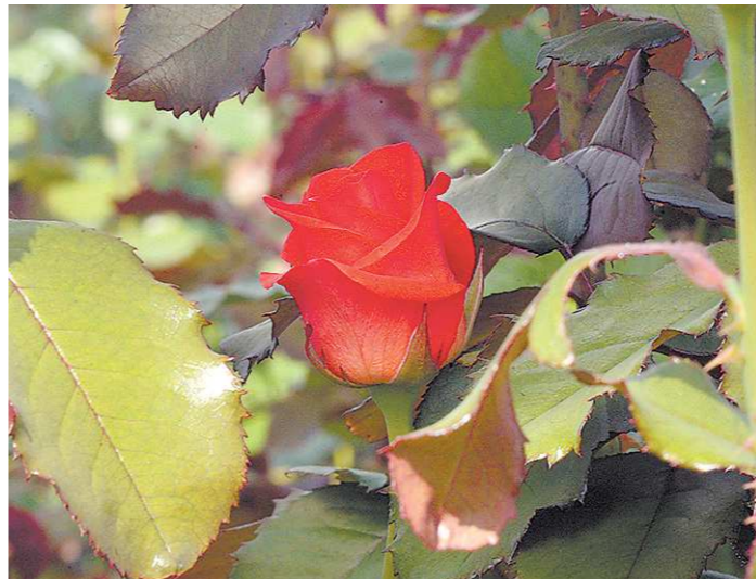
Первые заморозки не страшны для «королевы сада»

Сейчас слишком тепло для осенней обрезки, можно спровоцировать образование новых побегов, а в этом нет необходимости. Я обрезаю розы в зависимости от прогноза погоды, но чаще всего в конце сентября – начале октября, и ничего страшного, ес-