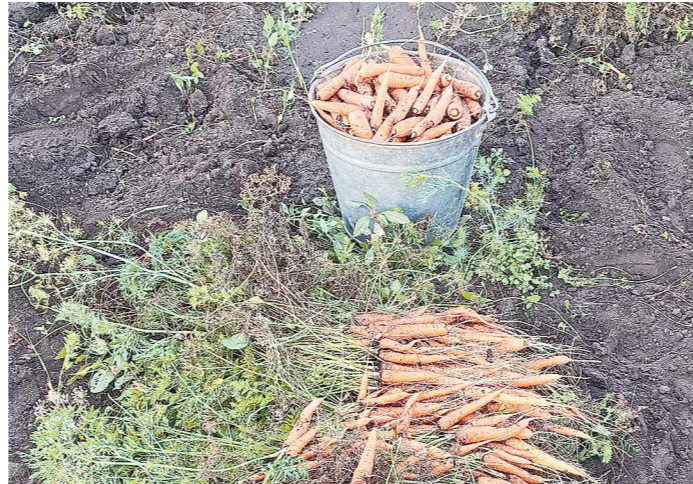
Ранние и средние сорта моркови плохо переносят понижение температуры, поэтому их надо убирать в первую очередь

пературе ниже 14°C, так что без укрытия или отопления новых зеленцов в холодном сентябре можно не ждать.