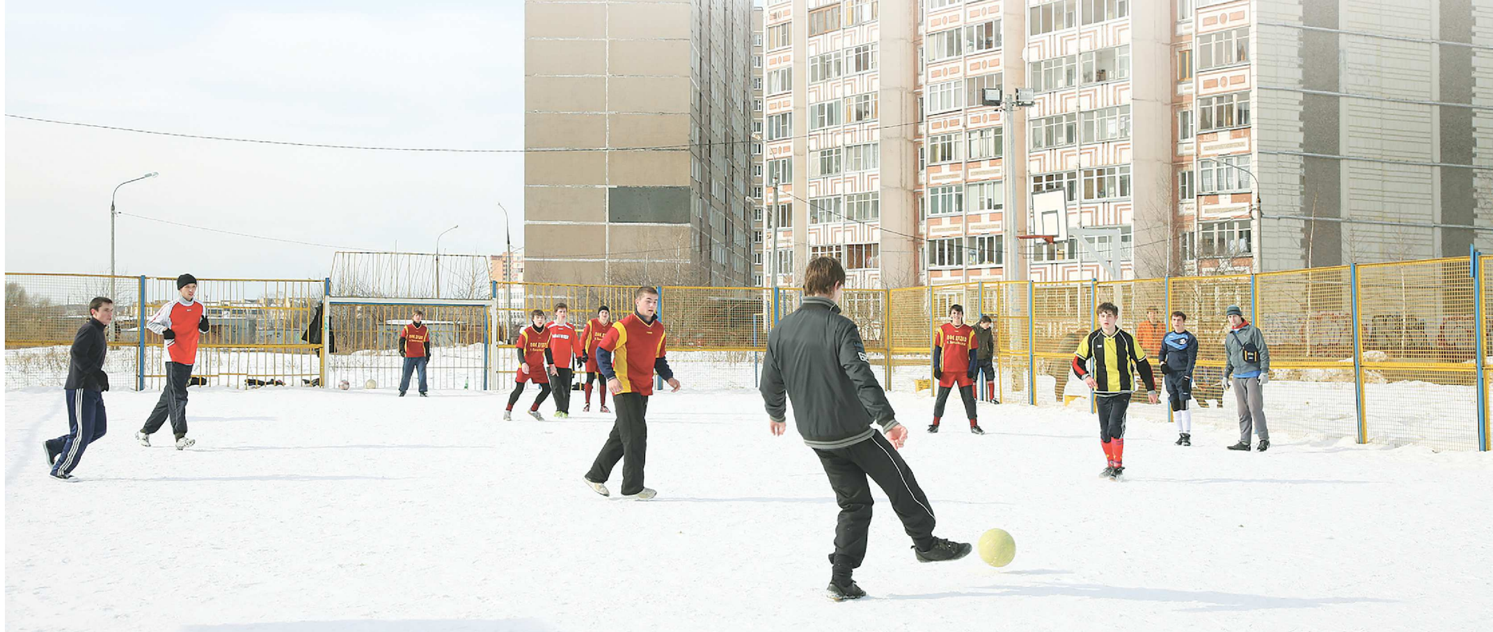
Пришкольные стадионы планируется использовать круглогодично, в зимний период их предварительно почистят от снега