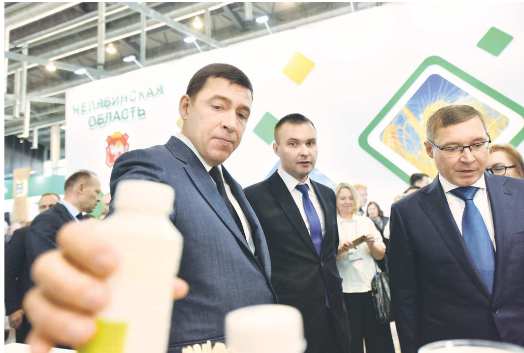
Губернатор Свердловской области Евгений Куйвашев и полпред Президента РФ Владимир Якушев после открытия выставки прошли по стендам и попробовали продукцию местных производителей

На стенде Свердловской области представлены достижения малых и крупных производителей сельхозпродукции: Рефтинской и Свердловской птицефабрик, свинокмплекса «Уральский», Ирбитского молочного завода, хлебокомбината «Смак», производителя иван-чая, чипсов из фруктов и овощей, варенья из сосисных шпикет «Китрей». Также на площадке «Екатеринбург-ЭКСПО» в эти дни проходит международная выставка сельскохозяйственной техники, материалов и оборудования для животноводства и растениеводства «АГРОПРОМ-УРАЛ». Здесь, в частности, представлены системы автопилота для уборочной техники, запчастей и техника для полива, тепличное оборудование, семена и агрохими-