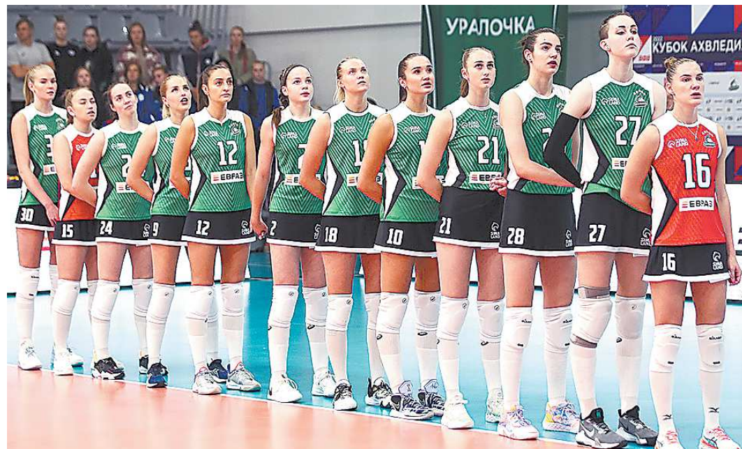
Предварительный раунд Кубка России прошел на площадке «Уралочки» – в Академии волейбола Николая Карполя

Свердловская команда вышла в полуфинальный раунд Кубка России, проиграв два матча из пяти