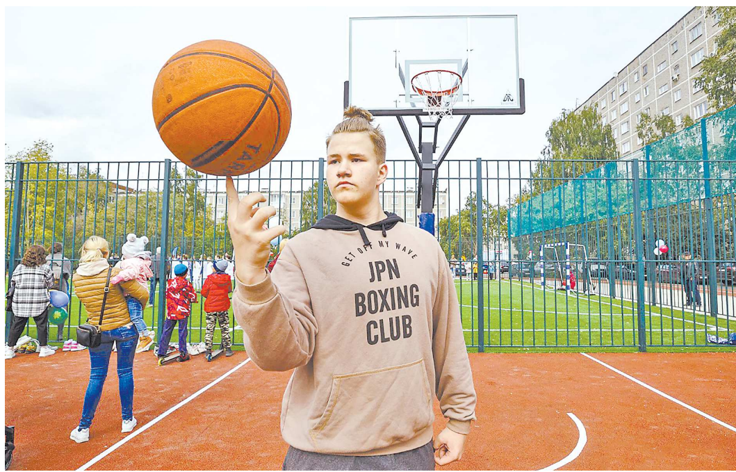
Доступные виды спорта и площадки в свободном доступе для населения будут публиковаться на официальных сайтах школ

Пришкольные стадионы Екатеринбурга открыли для горожан