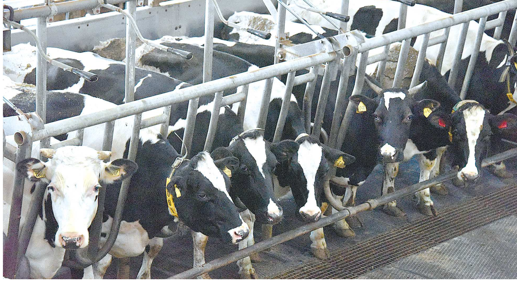
Аграрии уверены, что доходы от продажи молока сопоставимы с доходами от производства органического удобрения

До принятия нового закона правила утилизации отходов жизнедеятельности сельскохозяйственных животных были прописаны в федеральном законе «Об отходах производства и потребления». И, по сути, относительно навоза была правовая неопределенность: это отходы 3–5-го класса опасности (от умеренно опасных до неопасных. — Прим. ред.) или органическое удобрение? Теперь в этом вопросе появилась ясность. Для крупных хозяйств региона ситуация с принятием закона не изменится. У них и до этого процесс сбора отходов был организован грамотно: стоки и навоз помещаются в специальные хранилища — лагуны. Там массы обеззараживаются, и под воздействием