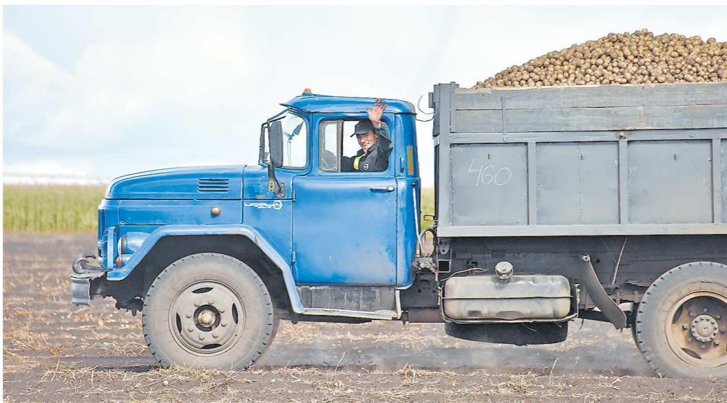
В первую очередь в хозяйстве в Белоярском районе собрали семенной картофель, он гораздо мельче того, что поставят в магазины

Что касается уборки зерновых, то в этом году урожайность выше – 29 центнеров с гектара, в прошлом году, из-за засухи этот показатель