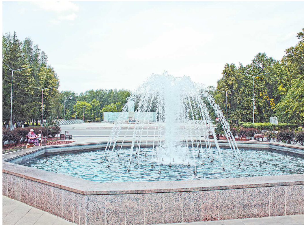
Фонтан в березовском парке Победы открыли в 2015 году, он сразу полюбился горожанам