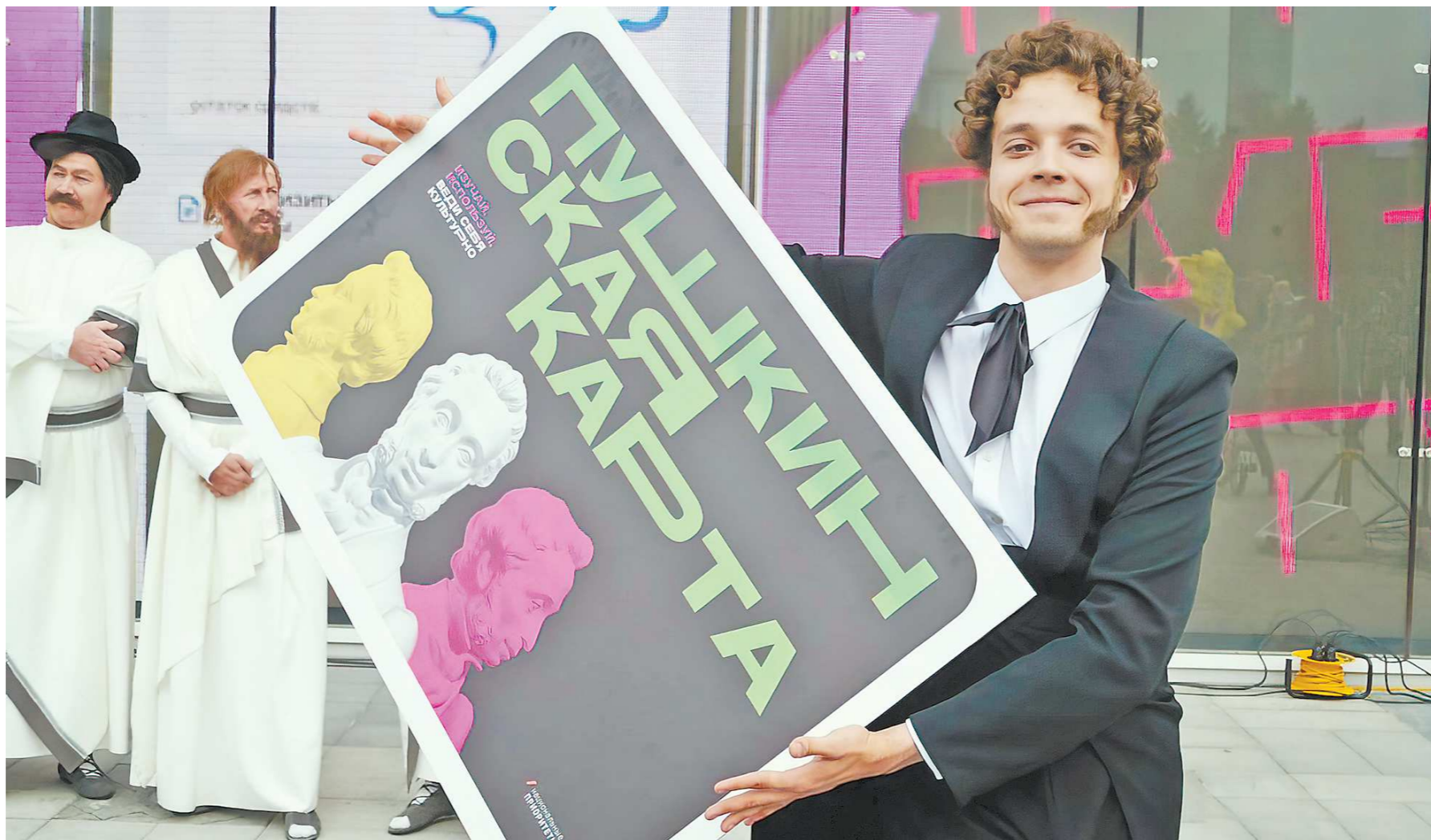
Перед организаторами стояла непростая задача – сделать так, чтобы великого писателя, ставшего лицом проекта, вспоминали только добрым словом. Спустя год видим, что Александр Сергеевич остался бы результатом доволен