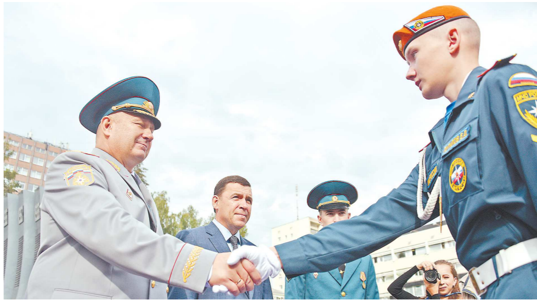
Глава МЧС РФ Александр Куренков и губернатор Евгений Куйвашев приняли участие в церемонии принятия присяги курсантами УГИПС

Около 200 первокурсников УГИПС принесли присягу сотрудникам МЧС. По традиции, будущие пожарные и спасатели дали клятву в присутствии своих близких и родных. В торжественной церемонии на площадке Советской Армии приняли участие глава МЧС Александр Ку-