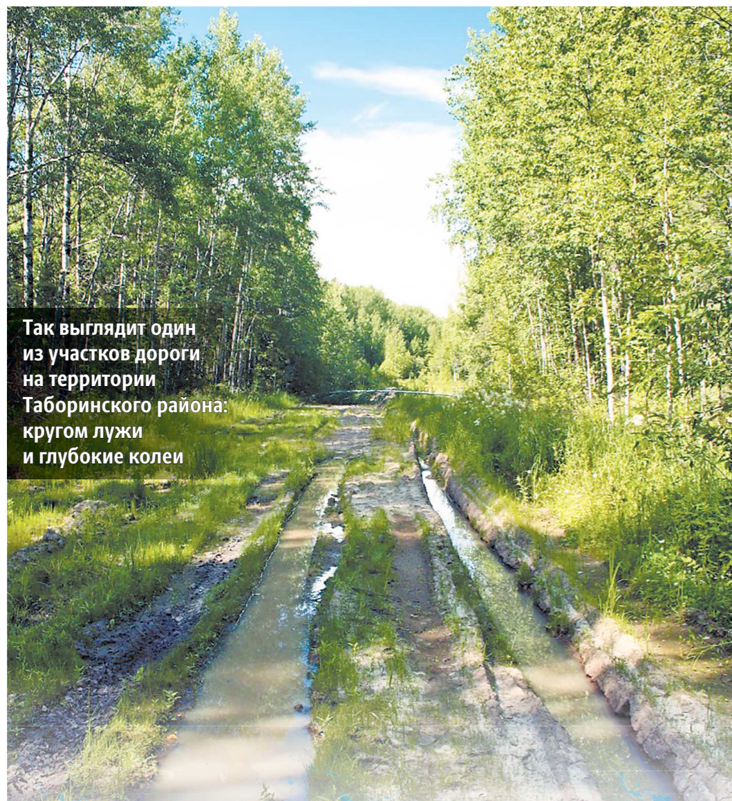
Так выглядит один из участков дороги на территории Таборинского района: кругом лужи и глубокие колеи

В Гаринском районе идет строительство новой межмуниципальной трассы