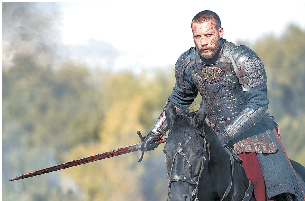
Исторический блокбастер «Сердце Пармы» с Александром Кузнецовым – не только одна из главных премьер осени, но и всего года