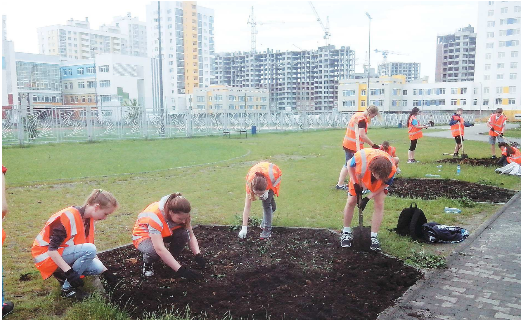
Большая часть трудоустроенных подростков в этом году занималась благоустройством

В основном они занимались работами по благоустройству территорий, оцифровке библиотечного фонда, прополке овощей. Случаи, когда школьники были устроены на производственные предприятия, – единичны. – Мы предлагаем подросткам временную занятость. Без специальности рассчитывать на что-то другое им не приходится. Чаще всего это некавалифицированный труд. Бывают случаи, ребенок обращается за помощью, и мы проводим профориентацию. В год устраивается на постоянную работу 50–60 человек. Наша позиция: подросток должен получить профессию, и только потом строить долгосроч-