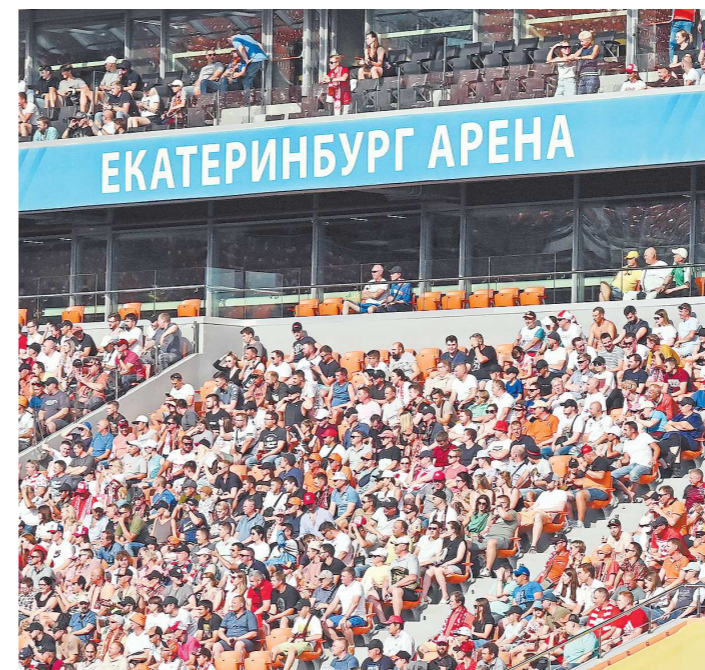
На матчах Кубка России система идентификации болельщиков не действует, так что есть надежда, что на матче с «Сочи» трибуны «Екатеринбург Арены» будут заполнены, как раньше