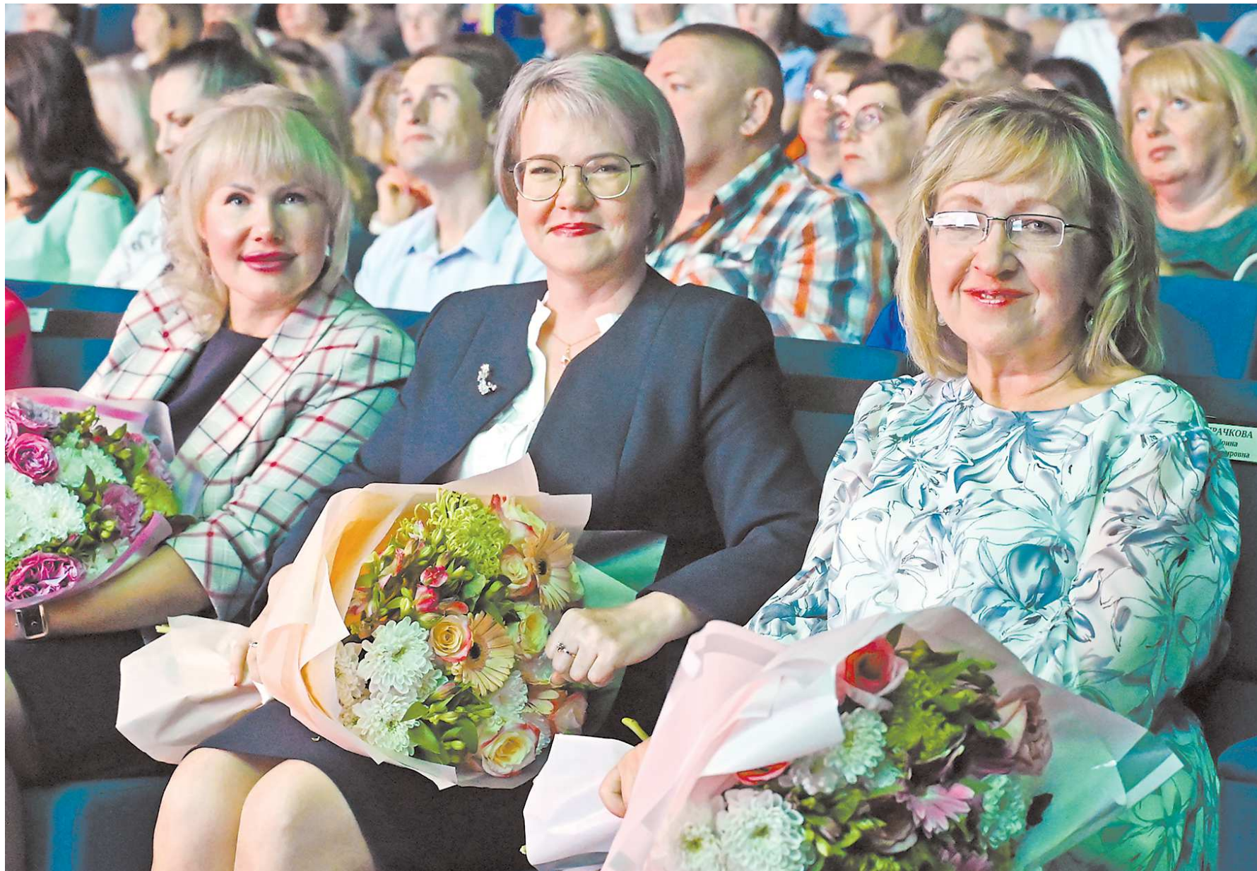
На августовской конференции свердловским учителям вручили награды за достижения в профессиональной деятельности

Одна из инициатив самих педагогов – создание в Свердловской области анало-