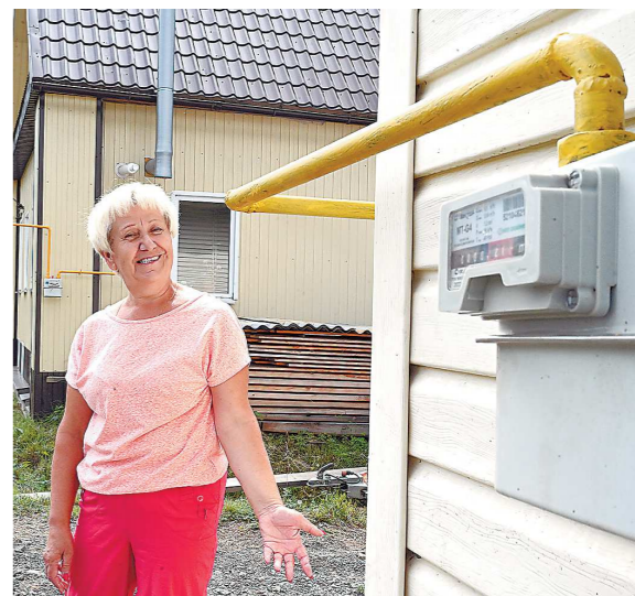
К концу года к газотранспортным сетям планируют подключить еще 27 тысяч домов