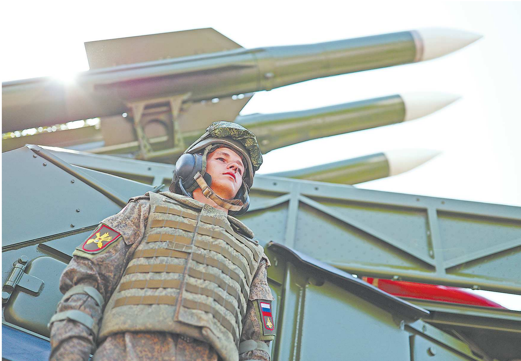
На форуме «Армия-2022» представлены современные образцы вооружения и экипировки военнослужащих

Уральскую оборонку представляют завод №9 и Уральский оптико-механический завод (УОМЗ) имени Э. С. Яламова. Завод №9 демонстрирует перспективные образцы артиллерийского вооружения, в числе которых – штурмовые орудия, гладкоствольные пушки и гаубица. Их отличиями являются высокая мобильность и транспортабельность, что позволяет при-