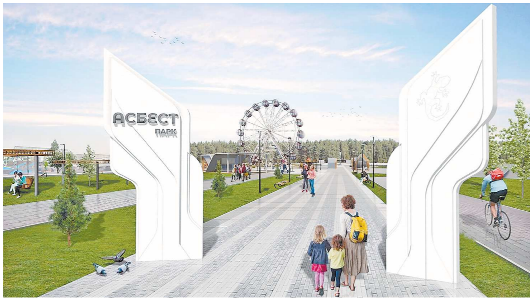
По проекту так будет выглядеть входная группа в асбестовский городской парк «Огненная саламандра»

Свердловские города-победители: Ревда (проект «Чеховский проспект»), Асбест (парк «Огненная саламандра»), Заречный (эко-парк на Белярском водохранилище), Березовский (проект улицы Театральной), Кировград (проект улицы Свердловская) и Туринск (проект улицы Горького). Всего на эти проекты из федерального бюджета выделят 510 млн рублей. Такую финансовую поддержку в рамках конкурса Сверд-