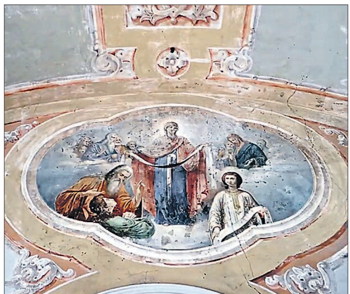
Внутри Спасо-Преображенской церкви в Нижней Синячихе сохранились росписи XIX века. В фильме этому уделено особое внимание