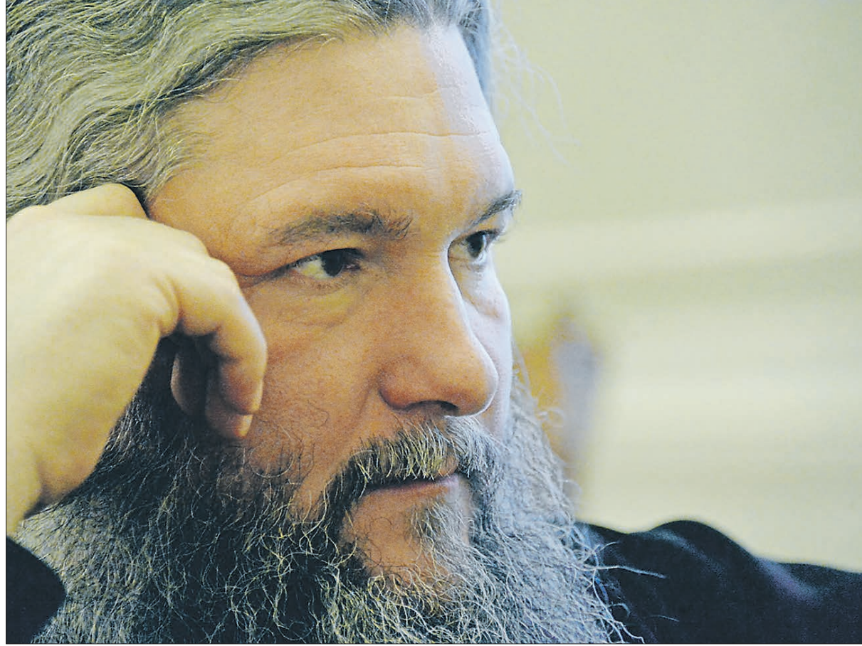
Митрополит Екатеринбургский и Верхотурский Евгений: «Есть много образов, связанных с церковью. Церковь — это корабль. На нём всегда есть экипаж. В этом отношении церковь — это люди, собравшиеся во имя Христа и образующие этот корабль. Одновременно и команду, и само судно»

Я сторонник мнения, что факт изучения людьми, детьми основ ре-