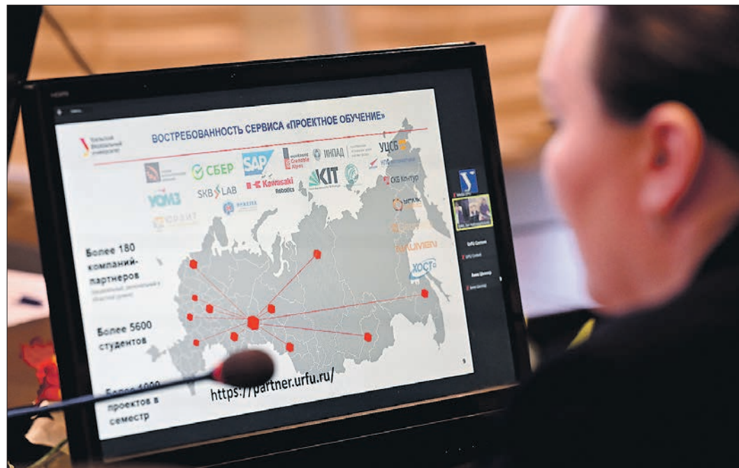
Цифровой характер проектного обучения позволяет вузу расширять географию своих партнёров

Границы факультета, программ, кафедр растворя-