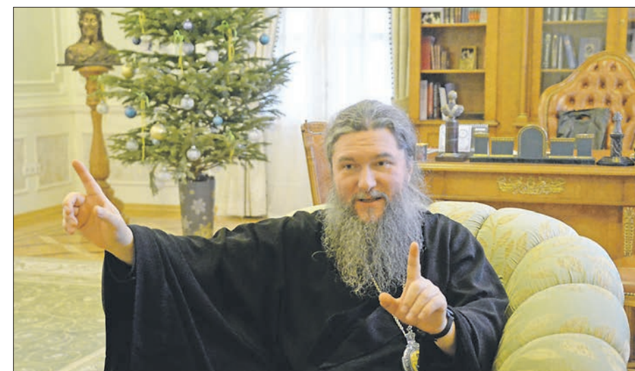
Беседа коснулась и светских вопросов, в частности — чтения. Оказалось, в приоритетах нашего собеседника, прошедшего обучение в Свято-Тихоновском богословском институте, — Бунин, Пушкин, Лев Толстой. «Войну и мир» читал взахлеб, дважды перечитывал»