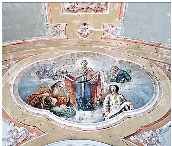
Внутри Спасо-Преображенской церкви в Нижней Синячихе сохранились росписи XIX века. В фильме этому уделено особое внимание