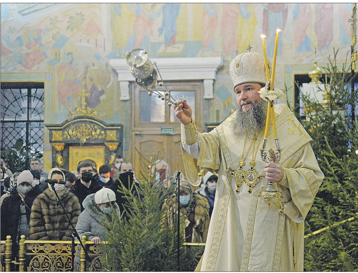
Митрополит Екатеринбургский и Верхотурский Евгений – член Высшего Церковного Совета Русской Православной Церкви

А про связь с системотехникой... Кафедра Московского авиационного института, на которой я обучался, занималась проблемами искусственного интеллекта. Сегодня эта тема актуальна как никогда. Но и на тот момент проводились очень интересные ис-