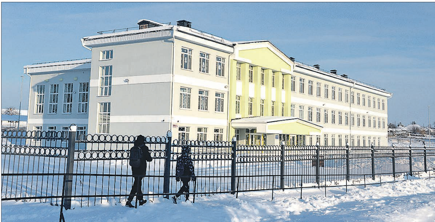
Новый вид школы

Суд удовлетворил иск о возмещении ущерба прокуратуры. Школу признали аварийной, было принято решение о приостановке эксплуата-