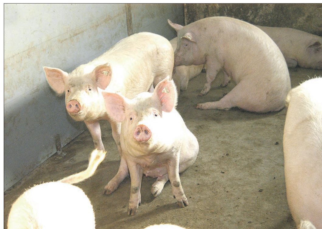
В сентябре прошлого года Свердловская область столкнулась с первой за последние 40 с лишним лет вспышкой на своей территории африканской чумы свиней. Спустя четыре месяца болезнь так и не отступила

«В настоящее время определяются угрожаемая зона и зона наблюдений, – сообщили в департаменте информа-