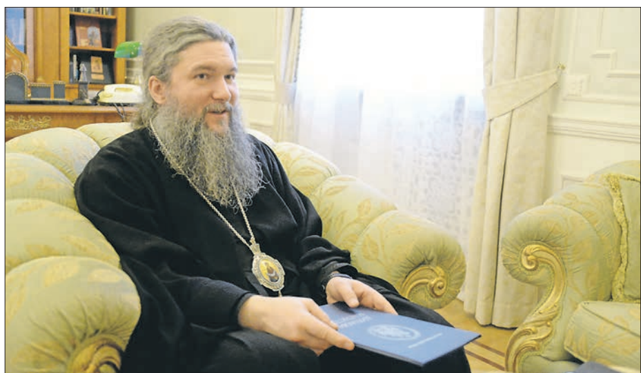
Во время встречи с «ОГ» Владыка с гордостью показал свой диплом магистра, который он защитил по теме «Интерактивное мультимедийное пособие по предкрещальной катехизации и по оглашению и последкрещальной катехизации»

— Не секрет, что с «Областной газетой» у нас очень добрые многолетние отношения. Вот как мы говорили про корабль. Газета — это тоже своего рода корабль. Во-первых, я хотел бы пожелать вам творческого вдохновения, признания читателей, чтобы та работа, то служение, которое вы несете — чтобы вам от них было хорошо. Я хочу пожелать симфонии отношений, доброты в коллективе, желания делать, нести добро. Сейчас не так много средств массовой информации целенаправленно дают позитив. Я желаю большого, интересного, созидательного позитива вам как главному редактору и вашему коллективу.