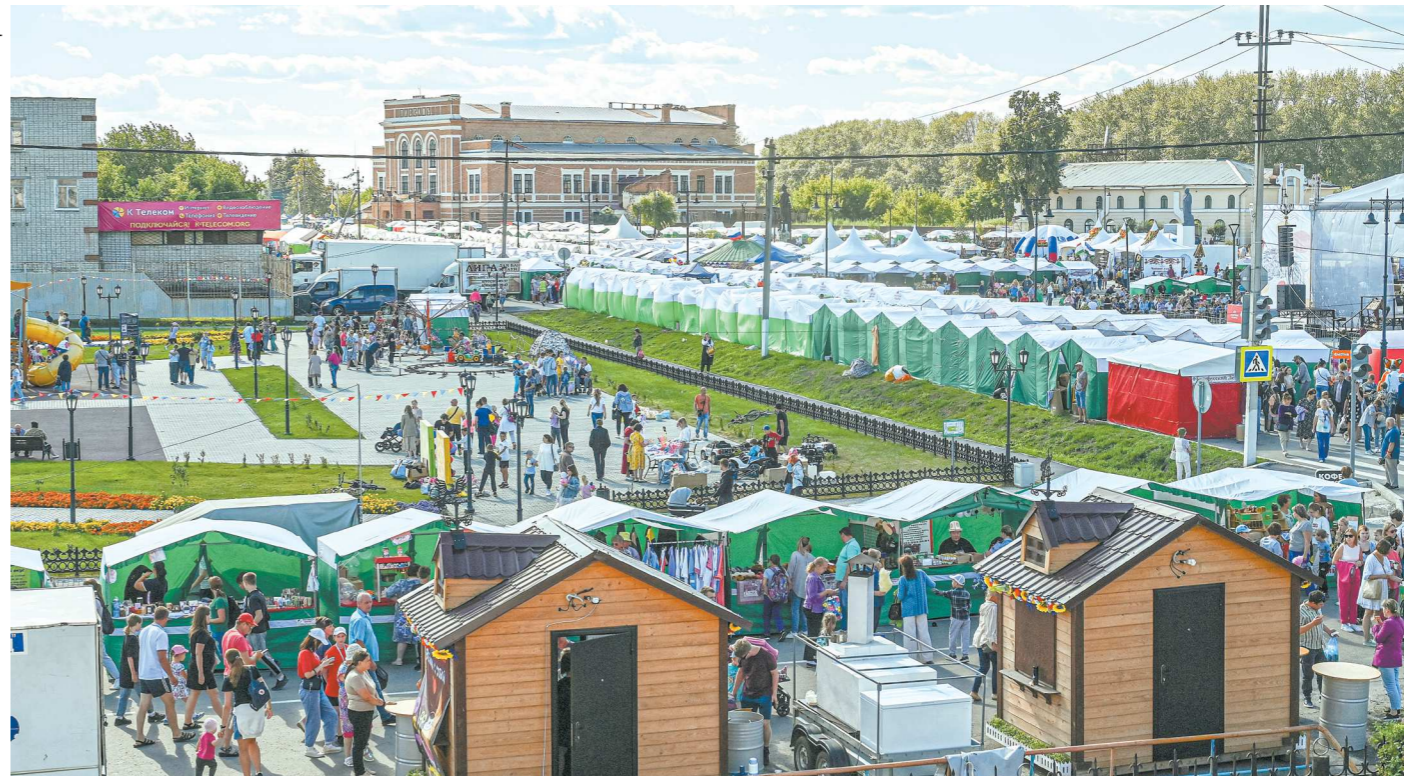
13 августа 2022 года: торговые ряды на ярмарке заняли всю площадь около Пассажа

ГОСУДАРСТВЕННОЕ БЮДЖЕТНОЕ УЧРЕЖДЕНИЕ СВЕРДЛОВСКОЙ ОБЛАСТИ «РЕДАКЦИЯ ГАЗЕТЫ "ОБЛАСТНАЯ ГАЗЕТА"». ОБЩЕСТВЕННО-ПОЛИТИЧЕСКОЕ ИЗДАНИЕ