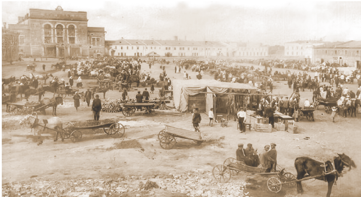
XVIII век: на ярмарку в Ирбит шли обозы с разных уголков страны