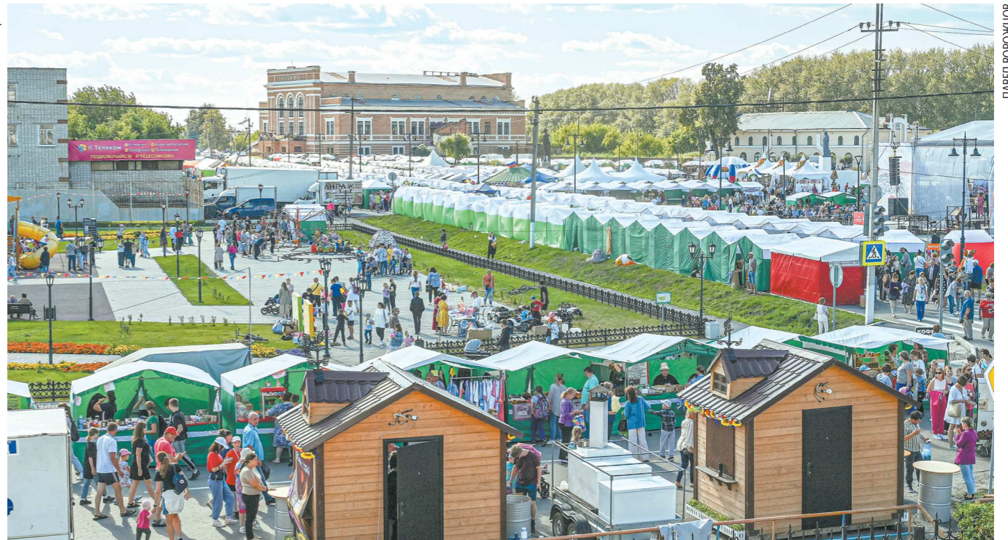
13 августа 2022 года: торговые ряды на ярмарке заняли всю площадь около Пассажа

ГОСУДАРСТВЕННОЕ БЮДЖЕТНОЕ УЧРЕЖДЕНИЕ СВЕРДЛОВСКОЙ ОБЛАСТИ «РЕДАКЦИЯ ГАЗЕТЫ "ОБЛАСТНАЯ ГАЗЕТА"». ОБЩЕСТВЕННО-ПОЛИТИЧЕСКОЕ ИЗДАНИЕ