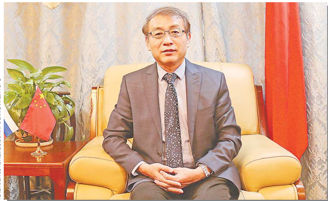
ГЕНЕРАЛЬНОЕ КОНСУЛЬСТВО КНР В ЕКАТЕРИНБУРГЕ, РФ

С начала текущего года международная ситуация складывалась сложно, мировой экономический рост претерпевал застой, в Китае в нескольких районах происходили новые вспышки коронавирусной эпидемии. Под влиянием множества непредвиденных факторов экономика Китая столкнулась с новым понижательным давлением и определенными колебаниями. Китайское правительство решительно отреагировало, ставя обеспечение стабильного экономического роста на передний план, в первое время предприняли целый пакет контрольных мер по стабилизации экономики, что позволило способствовать скорейшему возвращению национальной экономики в нормальное русло и поддержания ее функционирования в разумных пределах. Основные характеристики экономической деятельности Китая в первом полугодии сводятся к следующему: