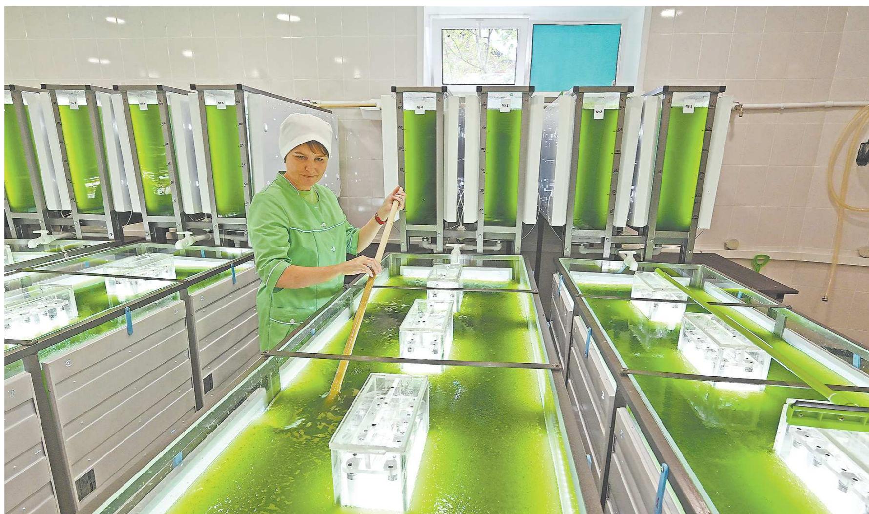
Специалисты в цехе бесперебойно поддерживают необходимый уровень освещения и температурного режима

Актуально применение хлореллы и в сельском хозяйстве. По своей питательности она превосходит злаковые, а по содержанию белка сопоставима с мясом, поэтому ее добавляют в корма для животных в качестве дополнительного источника витаминов.