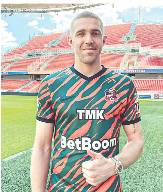
Юрий Газинский дебютирует в составе «Урала», скорее всего, уже в эту субботу – в матче против «Пари НН»

Вчера, 17 августа, екатеринбургский клуб «Урал» подписал контракт с 33-летним Юрием ГАЗИНСКИМ – экс-игроком «Краснодара», полузащитником сборной России в 2016–2020 годах.