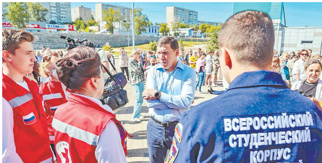
Глава региона обсудил с медиками эффективность действующих программ по привлечению врачей в малые города и села