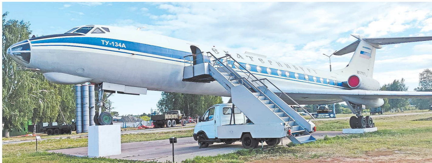
Экспозиции нового музея размещены в корпусе самолета Ту-134 А

На военном аэродроме «Кольцово» появилась выставочная площадка парка «Патриот»