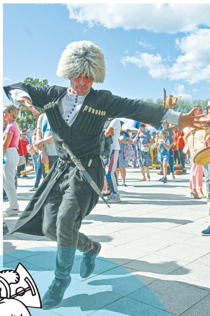
Чеченцы на своем национальном подворье развлекали ярмарку лезгинкой