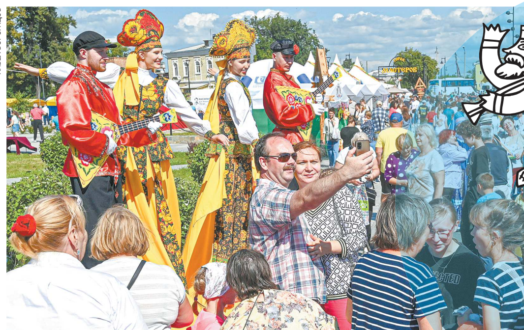
Сделать селфи на фоне трехметровых артистов на ходулях, в русских народных костюмах и с балалайками – желали многие