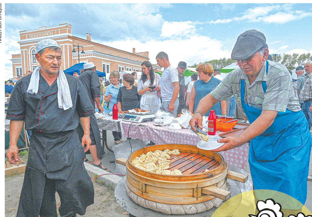
Целый торговый ряд заняли кулинары, на ярмарке они готовили манты, плов, разные виды шашлыков