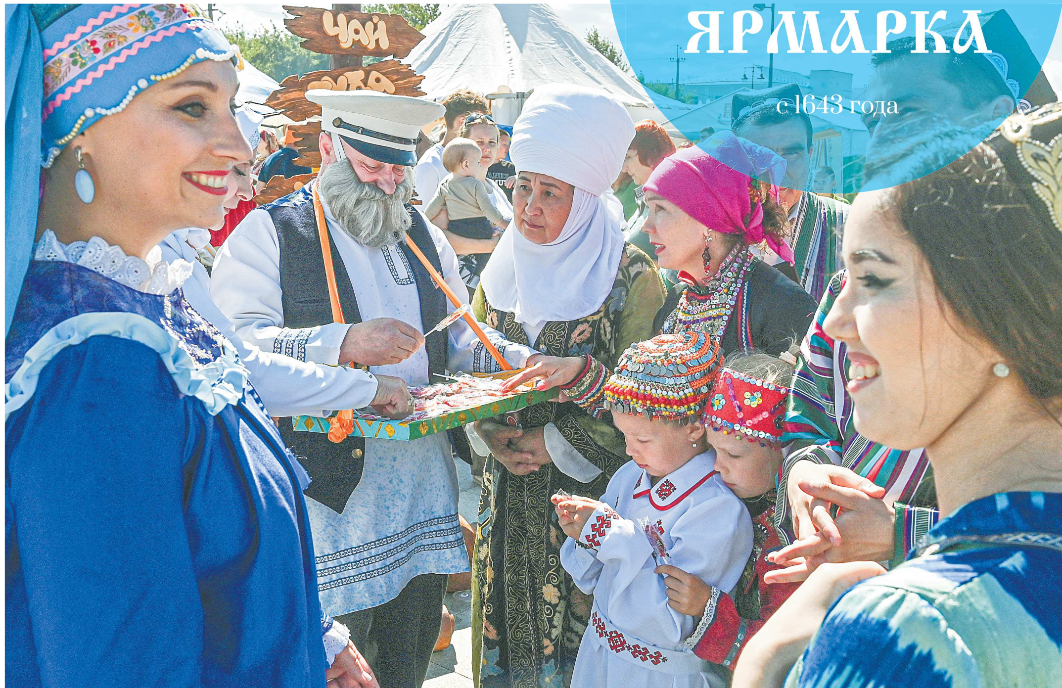
Представители разных национальностей собрались у лотка со старинным русским лакомством – «петушками» на палочках

Рядом с торговыми рядами на большой сцене пели и танцевали творческие коллективы из Ирбита, Екатеринбурга, Республики Крым; лучшие ремесленники в «Городе мастеров» давали мастер-классы всем желающим. В Сиреневом сквере, примыкающем к площади Ленина, разместился игровой городок – с каруселью, детскими электромобилями, фотозоной. В дни работы ярмарки по Ирбиту курсировали бесплатные экскурсионные автобусы, были открыты все музеи. Количество участников ярмарки превысило 45 тысяч человек – это рекорд для города (в прошлом году было на 5 тысяч меньше).