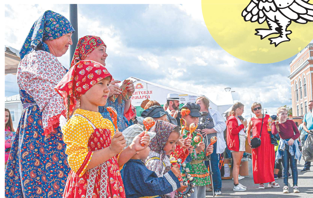
Ансамбль маленьких ложкарей одного из детских садов Ирбита дал мини-концерт на площади и сорвал овации