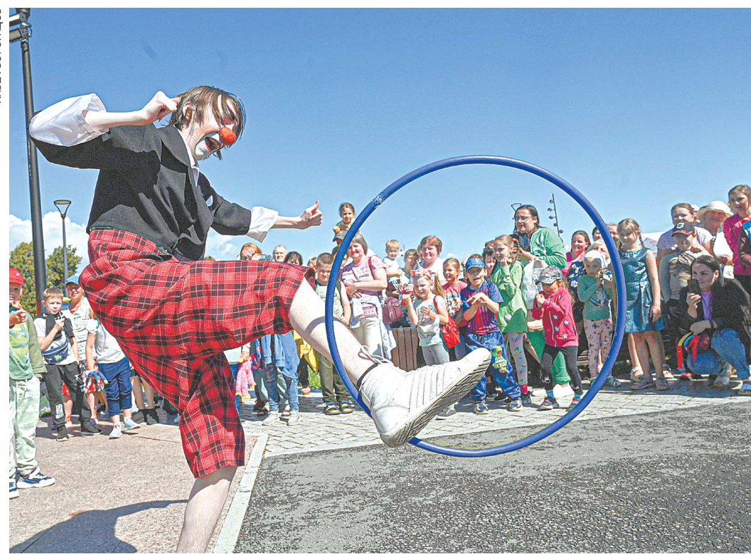
Школа-студия мим-клоунады «Ирбитские чудики» показывала трюки с обручем и фокусы