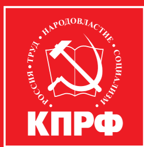
Материал опубликован безвозмездно. Предоставлено для публикации зарегистрированным кандидатом на должность Губернатора Свердловской области Деминым Александром Вячеславовичем.

Мы предлагаем на время освободить от выплат в Соцстрах предпринимателей, которые берут к себе студентов и выпускников без опыта работы. Эту идею необходимо реализовать на областном уровне.