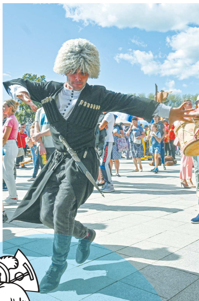
Чечены на своем национальном подворье развлекали ярмарку лезгинкой