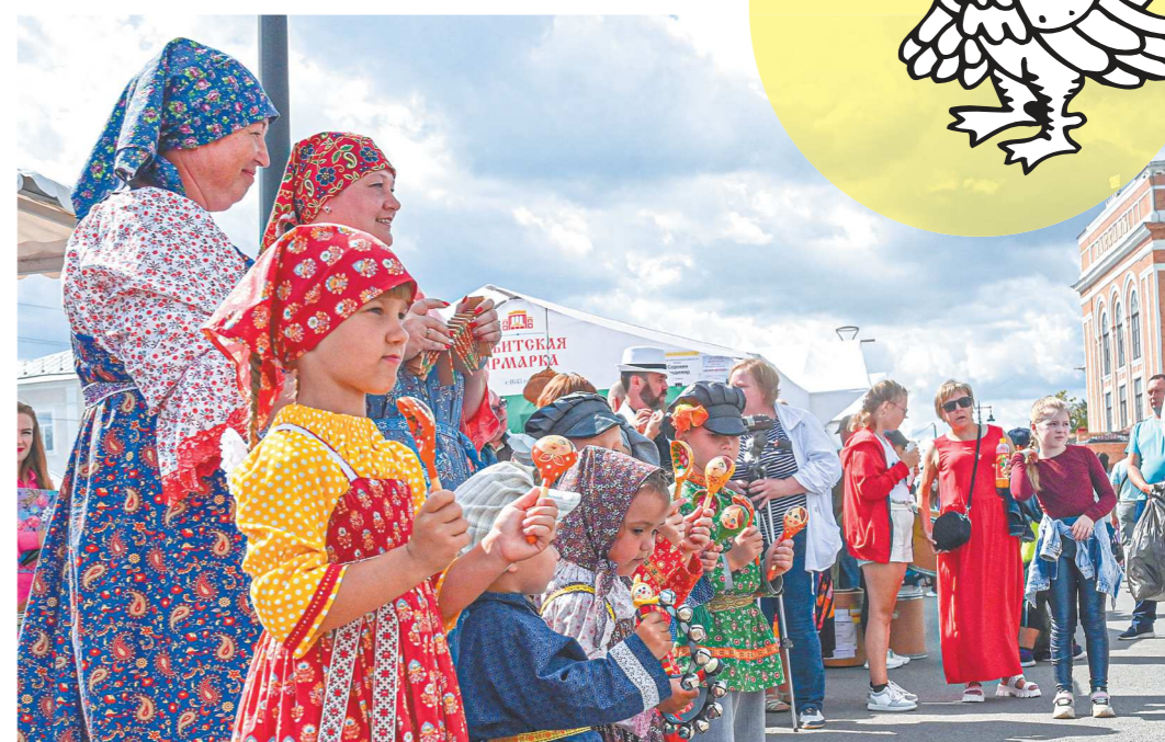
Ансамбль маленьких ложкарей одного из детских садов Ирбита дал мини-концерт на площади и сорвал овации