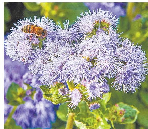
Агератум сохраняет декоративность на протяжении всего лета

По окончании сезона всю растительность из теплицы необходимо убрать, включая сорняки (крапиву и сныть), растительные остатки надо сжечь. Землю в парнике, так же, как и стелю, можно обработать химпрепаратами от вредителей. Если помещение лучше держать открытым, чтобы хорошо проморозить почву.