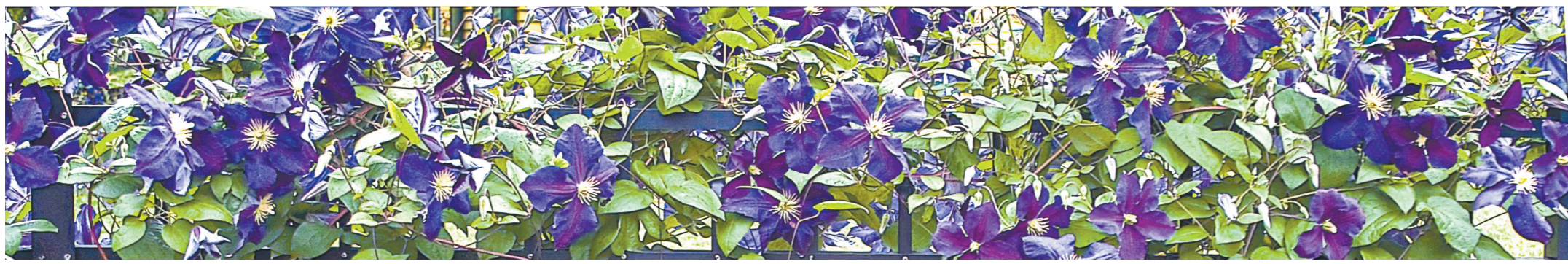
Для выращивания на Среднем Урале подходят гибриды клематисов третьей группы обрезки, они более устойчивы к суровому климату