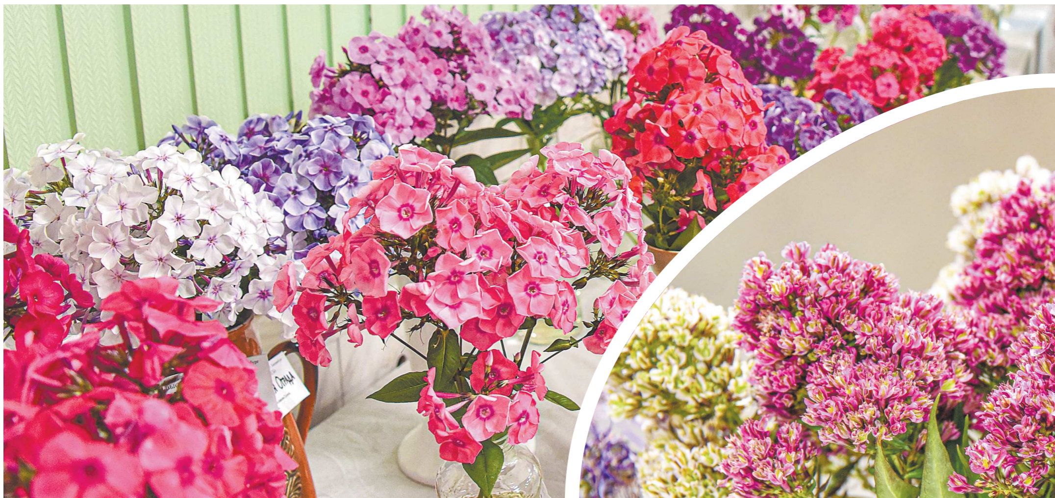
Аромат флоксов для помещений – слишком сильный, в непроветриваемом помещении запах будет насыщенным и раздражающим (как у лилий), поэтому чаще всего эти цветы не используют для букетов

В екатеринбургском Ботаническом саду прошла выставка флоксов и клематисов