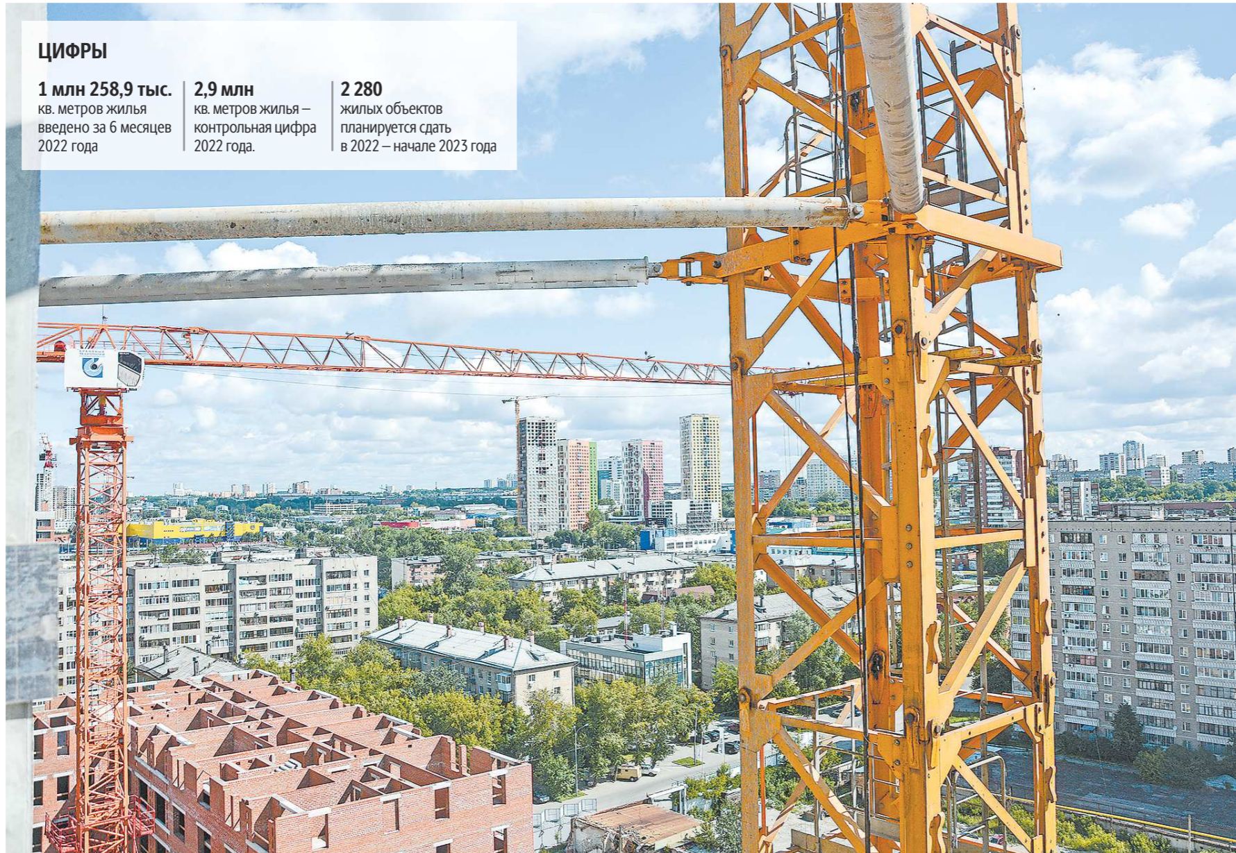
Если стройка живет – экономика на подъеме