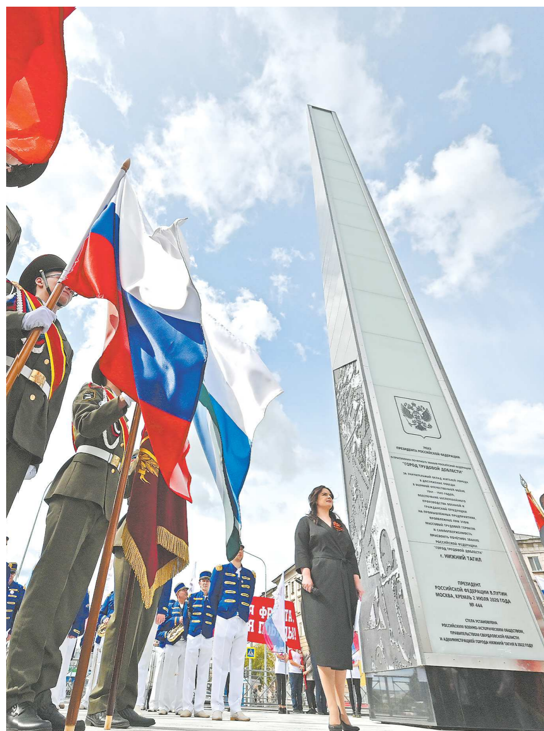
Стела расположена около вокзала – объект будет первым, что увидят гости города, которые приезжают в Нижний Тагил на поезде или на автобусе

Металлургическая столица Урала отмечает юбилей