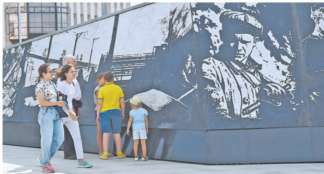
Стелы «Город трудовой доблести» выполняются по типовому проекту, но в каждом городе они уникальны. Каждая олицетворяет особый вклад жителей в Победу в Великой Отечественной войне – эту историю подвига можно увидеть на пилонах

В Нижнем Тагиле вчера начались мероприятия, посвященные 300-летию города. В первый из трех дней, в течение которых продлятся торжества, представители региональных властей открыли стелу «Город трудовой доблести» и мост через Городской пруд.