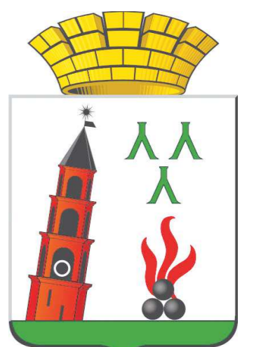
Наклонная башня – символ Невьянска. Она изображена на гербе города

– На самом деле никто не знает правды, насколько я помню, все версии существуют как реально возможные. Мне больше нравится версия, что это задумка архитектора. А сама конструкция нашей башни намного интереснее, чем у Пизанской. Более того, Невьянская башня практически не падает. Просто стоит под углом.