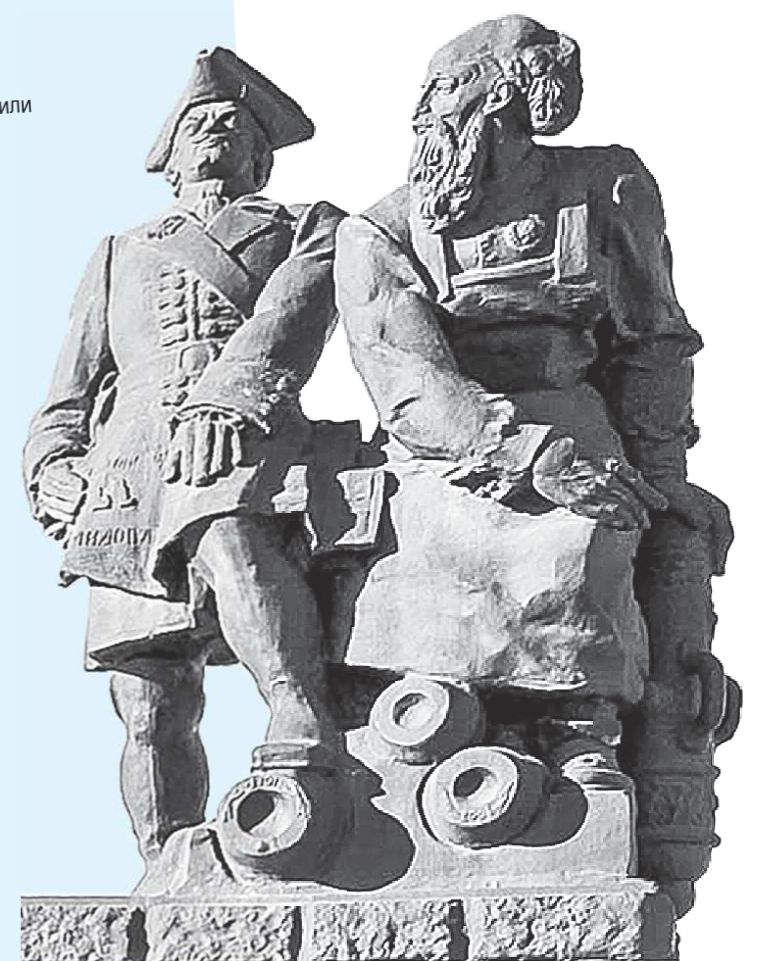
Памятник Петру I и Никите Демидову был открыт в Невьянске 19 июля 2002 года на территории историко-архитектурного комплекса «Старый Невьянский завод»