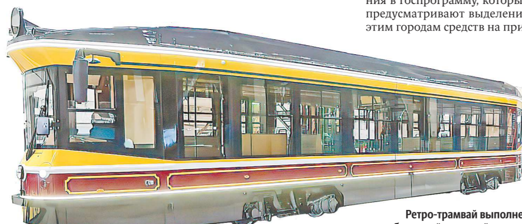
Ретро-трамвай выполнен в желто-бордовой цветовой гамме – похожая раскраска была у вагонов советского времени

Уральской столице выделит дополнительные средства на покупку троллейбусов. Как сообщили в департаменте информполитики области, Минпромторг России одобрил областную заявку на предоставление одного миллиарда рублей для обновления пассажирского состава. Деньги из федерального бюджета поступят до конца года.