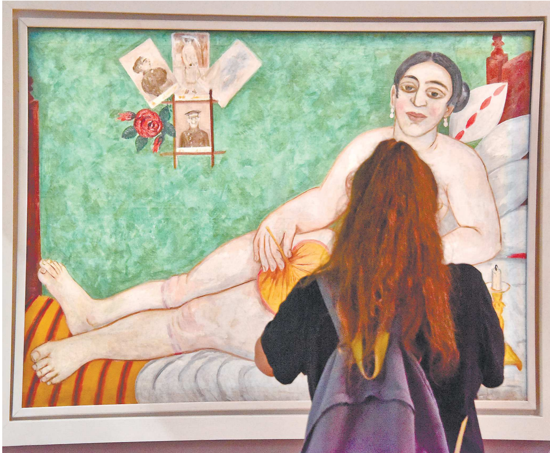
Картина Михаила Ларионова «Еврейская Венера», 1912 год

Работы авангардистов вернулись в Екатеринбург, в родной музей, после довольно длительного турне по другим странам. Коллекция даже частично не выставлялась на Урале в последние несколько лет. А была в Венгрии, Чехии и в Южной Корее. Из последней страны работы пришлось возвращать уже при содействии Министерства культуры Российской Федерации и Посольства РФ. Началась военная спецоперация на Украине, и коллекция «застряла» на Корейском полуострове. В итоге совместно удалось решить все логистические трудности по доставке, и в мае картины через Турцию вернулись в Москву, а затем на Урал. Поэтому и название выставки – «Великий переход» – не только отражает ту трансформацию искусства, которая была на рубеже XIX и XX веков, но и сложную историю возвращения работ на родину. В итоге в музее приняли решение впервые показать всю коллекцию, которая с таким трудом возвращалась в родные стены.