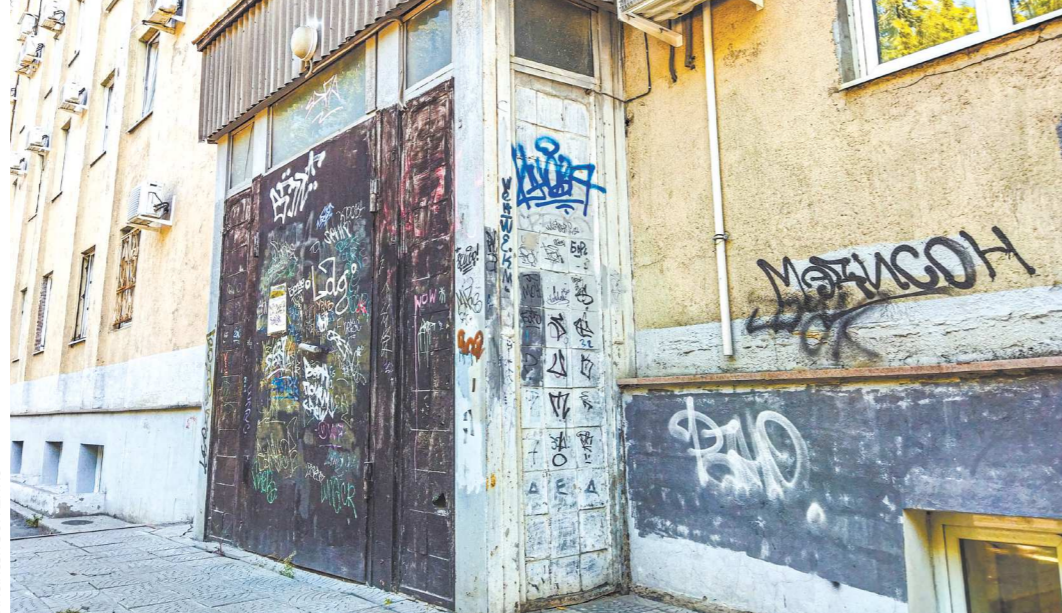
Боковой фасад административного здания на Малышева, 101 испан и поперёк: старые рисунки уже успели потускнеть

Администрация Екатеринбурга вместе с общественниками разработала комплекс мер по борьбе с вандалами, которые портят внешний облик города, сообщил глава города Алексей Орлов на заседании общественного совета по сохранению и развитию культурного наследия уральской столицы. В их числе – деанонимизация нарушителей в Telegram с помощью камер системы «Безопасный город», увеличение штрафов, усиление патрулирования общественных пространств.