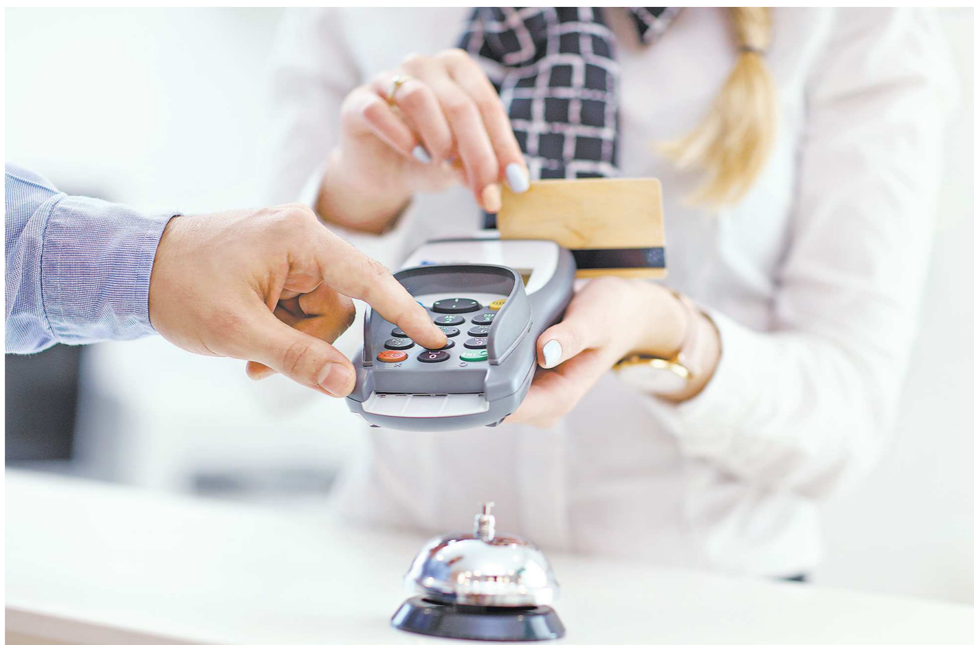
Туристический сбор на 80% повторяет идею курортного, который экспериментально введен в РФ с 2018 года в Краснодарском, Ставропольском и Алтайском краях. В 2018–2021 гг. властям Алтайского края удалось собрать с туристов 115,6 млн руб., Ставропольского – 904,5 млн руб., Краснодарского – 538,1 млн руб. Размер платежа в этих субъектах составлял не более 50 рублей в сутки