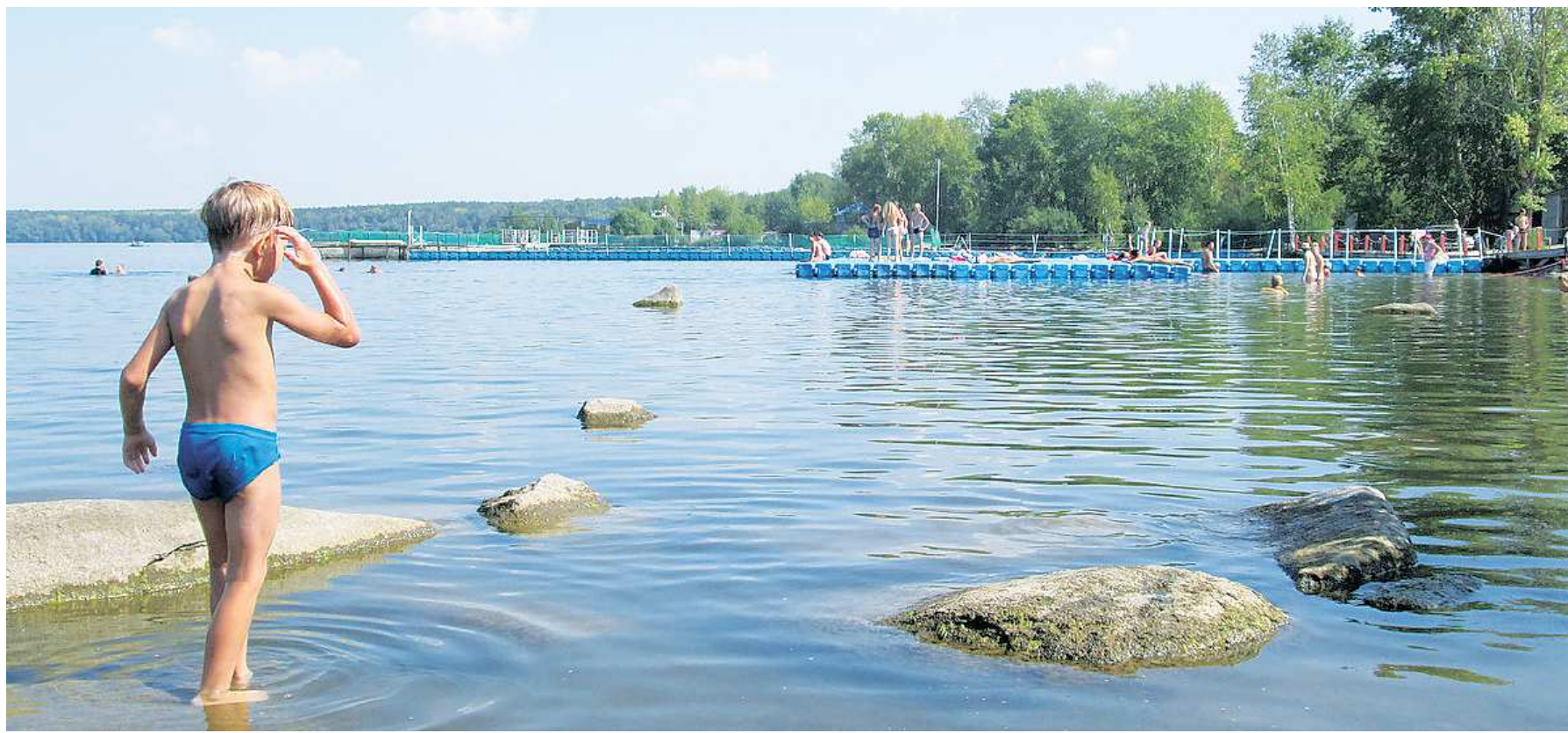
С начала лета в ходе профилактических рейдов к административной ответственности за оставление детей без присмотра на воде привлечено 67 свердловчан