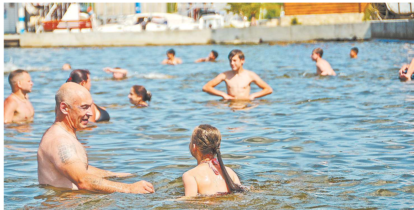
Сотрудники МЧС призывают свердловчан внимательно следить за детьми и не оставлять их без присмотра у водоема

По словам представителя МЧС, несовершеннолетние гибнут в основном по вине родителей. Взрослые отвлекаются, не следят за детьми, те остаются предоставленными сами себе.