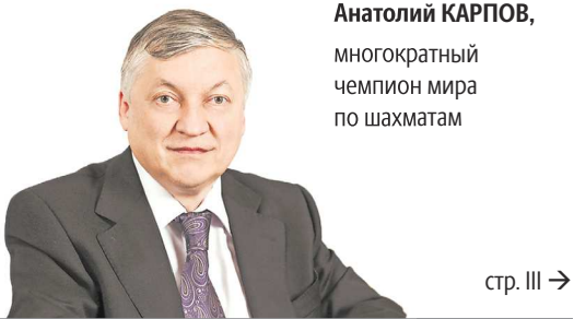
Анатолий КАРПОВ, многократный чемпион мира по шахматам

“ Пандемия внесла коррективы в нашу жизнь, люди соскучились по общению и шахматным турнирам.