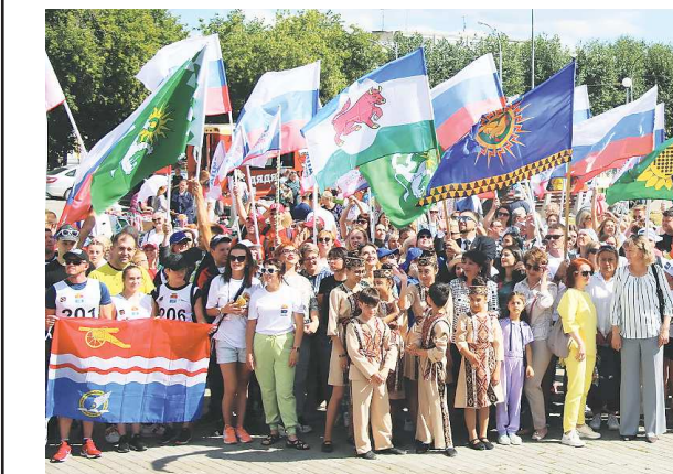
ПОРТЛ «ВИРТУАЛЬНЫЙ КАМЕНСК-УРАЛЬСКИЙ»

В выходные в Каменске-Уральском отпраздновали 25-летие Южного управленческого округа Свердловской области, сообщил «Виртуальный Каменск».