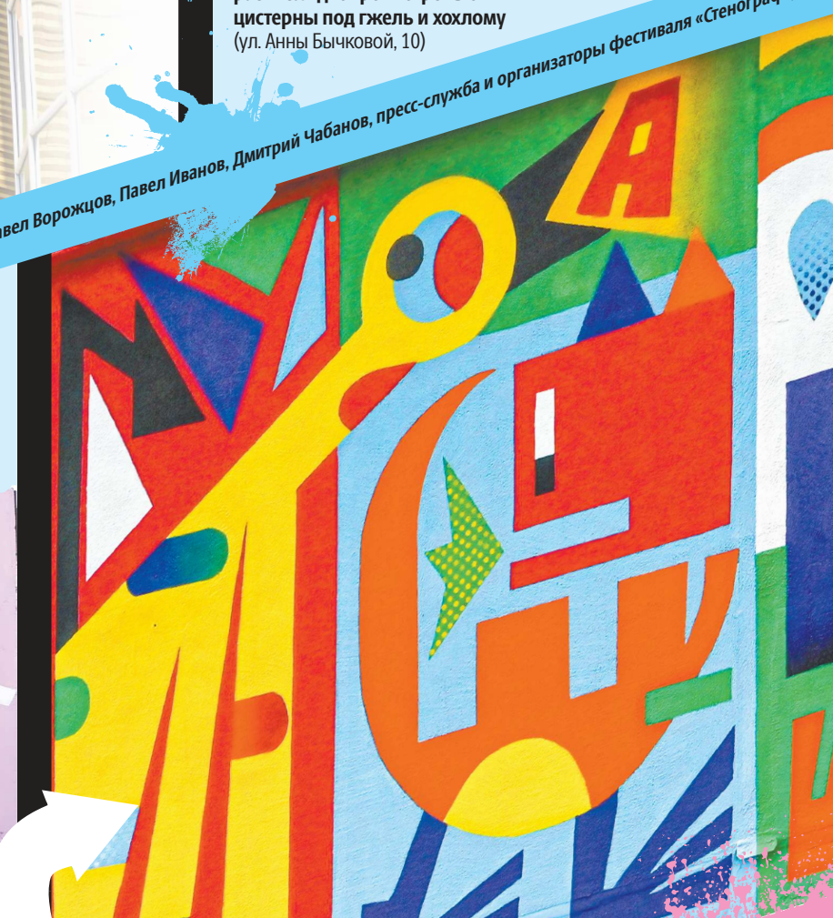
Венгерских Коммунаров, 10/ул. Татищева, 49б. Арт-объект Анастасии Вокиной (Санкт-Петербург) выполнен в абстрактном стиле и носит название «Веселые картинки»