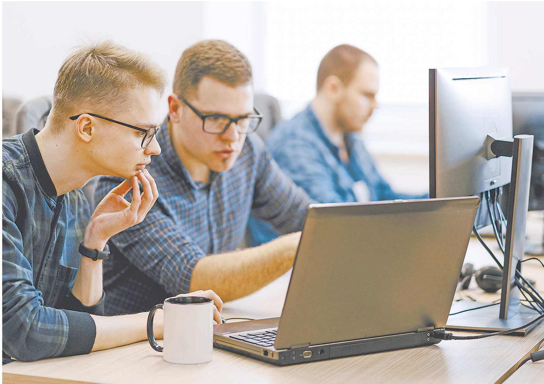
По данным министерства науки и высшего образования РФ, на 2022/2023 учебный год количество бюджетных мест увеличилось по 63 направлениям, связанным с информационными технологиями. За счет федерального бюджета получать высшее образование в IT-сфере смогут теперь более 160 тысяч студентов

– В этом году без вступительных испытаний к нам поступают 170 человек, почти