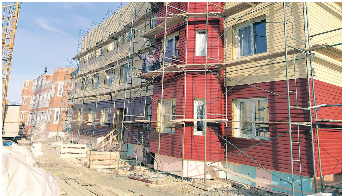
Дом по улице Кузнецова, 6В в поселке Лобва (Новолялинский ГО) планируется сдать осенью этого года. Фасад здания обшит сайдингом, в квартирах – пластиковые окна и чистовая отделка

Раселять аварийное жилье, признанное таковым до 1 января 2017 года, на Среднем Урале начали в 2019 году, в рамках нацпроекта «Жилье и городская среда». В области приняли программу «Переселение граждан на территории Свердловской области из аварийного жилищного фонда в 2019–2025 годах».