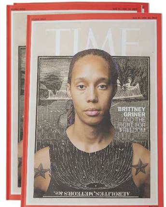
История Бриттни Грайнер стала главной темой ближайшего выпуска журнала «Тайм»

В среду, 27 июля, в Химкинском городском суде Московской области прошел допрос экс-баскетболистки БК «УТМК» Бриттни ГРАЙНЕР, которая обвиняется в контрабанде наркотиков. В тот же день телеканал CNN сообщил, что президент США Джо БАЙДЕН поддержал план обмена спортсменки и еще одного американца на россиянина Виктора БУТА, уже больше десяти лет сидящего в тюрьме штата Иллинойс.