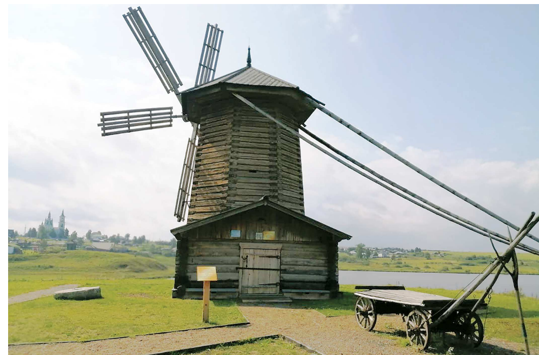
Мельница-шатровка — уникальный экспонат музея