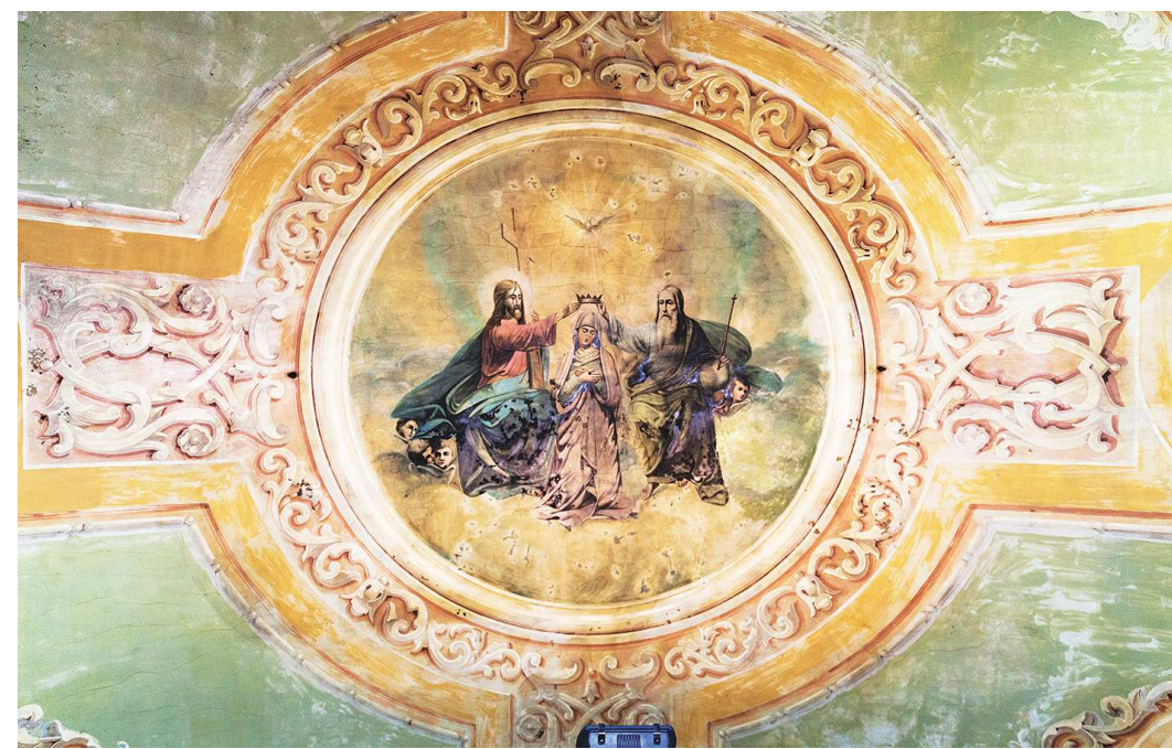
Роспись на своде первого этажа Спасо-Преображенской церкви изображает библейский сюжет — Величие Пресвятой Богородицы