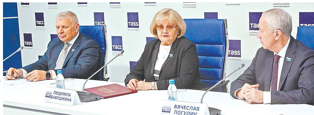
На весенней сессии депутаты рассмотрели 100 законопроектов

На вчерашней пресс-конференции представители Законодательного собрания Свердловской области рассказали о ключевых законах, принятых на завершившейся на днях весенней сессии. Депутаты рассмотрели многомиллиардные меры социальной поддержки для детей-сирот, учителей и врачей, а также ввели новое почетное звание — Заслуженный учитель Свердловской области.