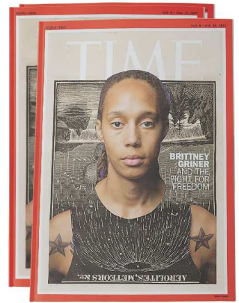
История Бриттни Грайнер стала главной темой ближайшего выпуска журнала «Тайм»

В среду, 27 июля, в Химкинском городском суде Московской области прошел допрос экс-баскетболистки БК «УТМК» Бриттни ГРАЙНЕР, которая обвиняется в контрабанде наркотиков. В тот же день телеканал CNN сообщил, что президент США Джо БАЙДЕН поддержал план обмена спортсменки и еще одного американца на россиянина Виктора БУТА, уже больше десяти лет сидящего в тюрьме штата Иллинойс.