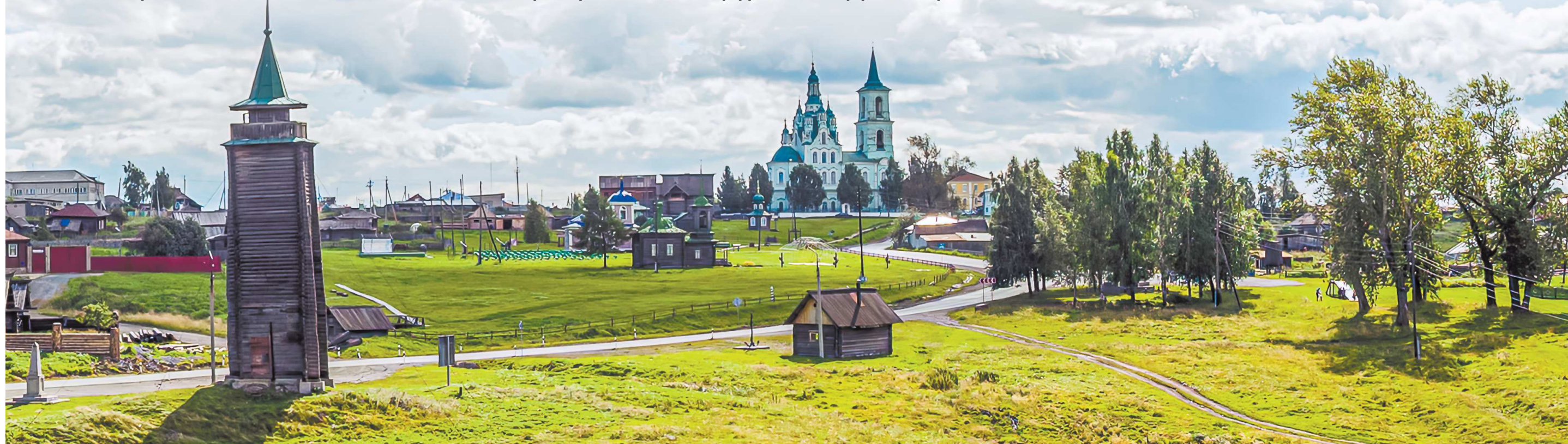
Музейные объекты в полной мере воссоздают традиционную модель старой русской деревни

Жители свердловского села не позволяют исчезнуть традиционному уральскому ремеслу