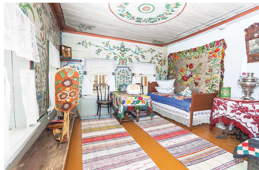
Интерьер внутри старинных изб соответствует быту крестьян XIX века