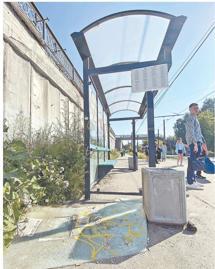
Остановочный комплекс «Шарташ» на улице Блюхера обновили в прошлом году. Практически сразу его разрисовали, а в начале июля выбили боковые стекла

Денежные взыскания (за вандализм предусмотрены штрафы до 40 тысяч рублей или в размере трехмесячной зарплаты) или реальные аре-