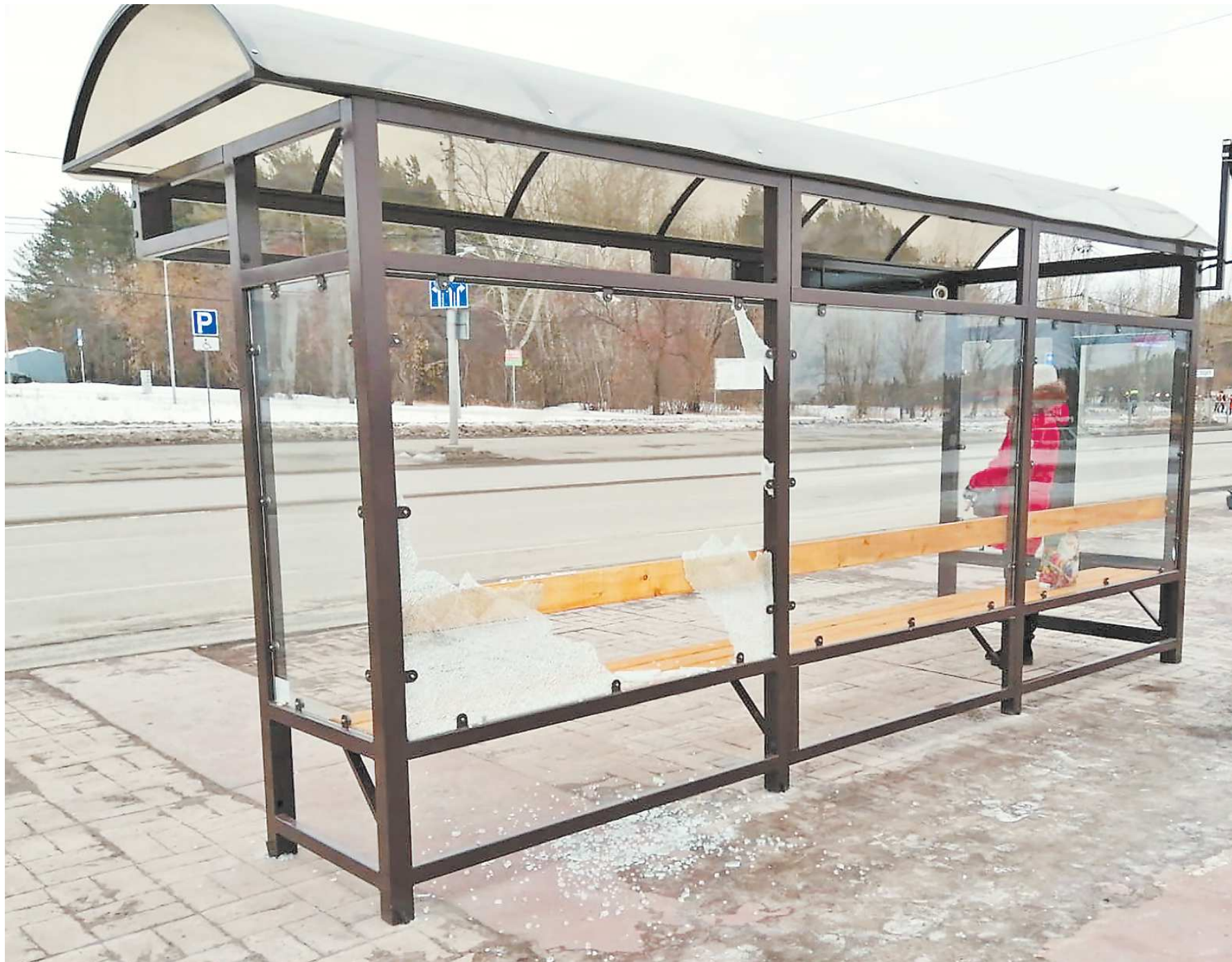
Закаленное стекло в четыре-пять раз прочнее, чем обычное, но от сильного целенаправленного удара тоже ломается, разбиваясь на мелкие осколки с тупыми краями

ПРЕСС-СЛУЖБА АДМИНИСТРАЦИИ КАМЕНСКО-УРАЛЬСКОГО