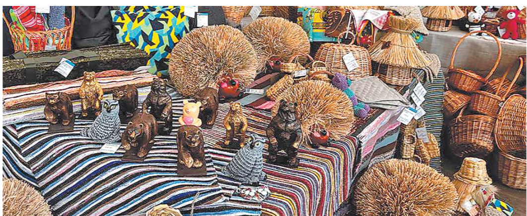
Плетеные сувениры и вязаные коврики на выставку привезли из Пермского края