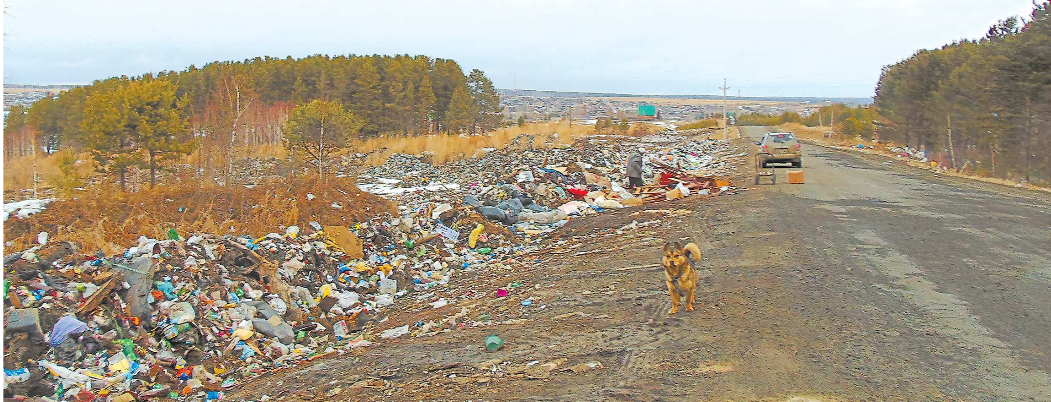
Придорожные поля и леса постепенно превращаются в нелегальные свалки

За выброс мусора из авто теперь штрафуют