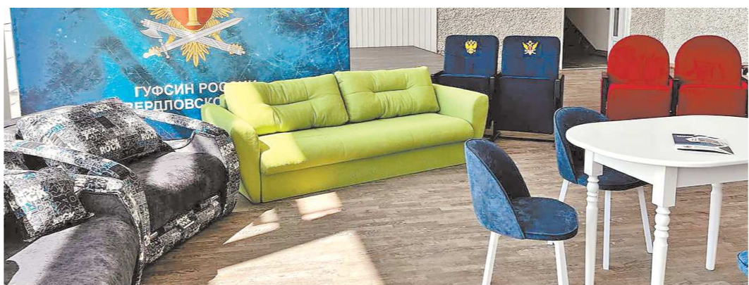
Мягкую мебель изготавливают в трех колониях Свердловской области