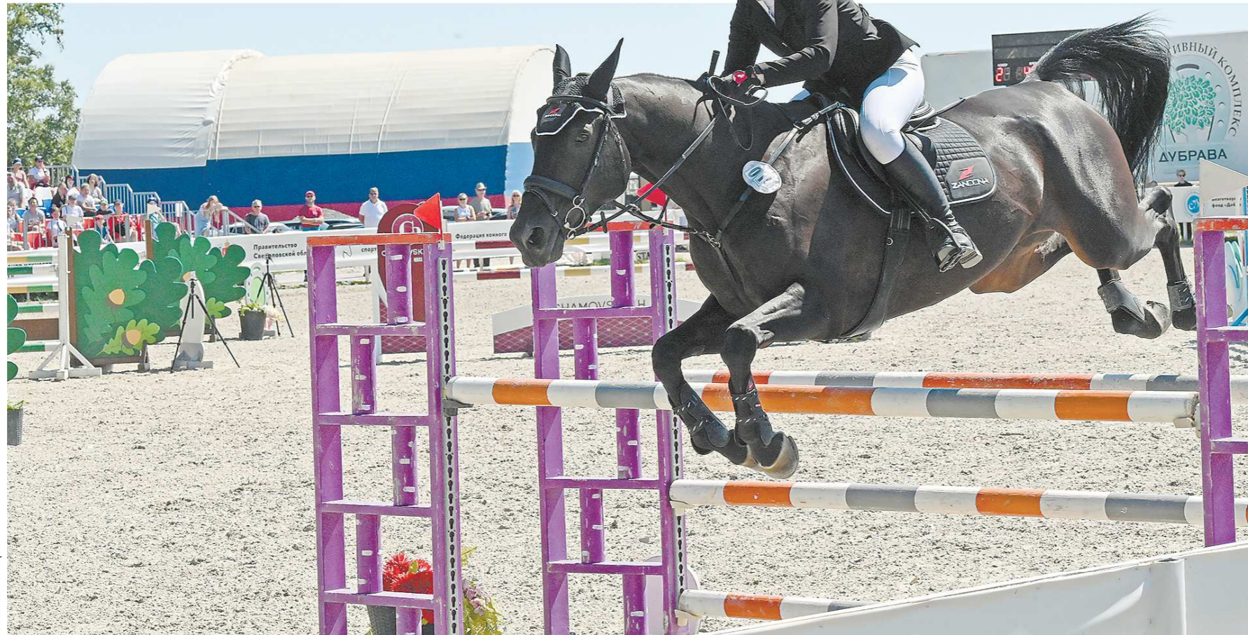
Пройти трассу без штрафных очков получилось не у всех – некоторые скакуны задевали барьеры, а кого-то даже дисквалифицировали за неповиновение лошади

Чуть поодаль от конкурного поля в тени расположился большой шатер, в котором