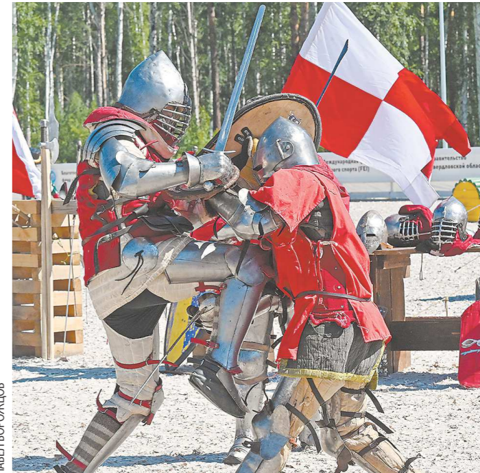
Полный доспех рыцаря легко может достигать 30-40 килограммов, под латы поддевают еще стеганный гамбезон из ваты, поэтому, чтобы сражаться на жаре, нужна серьезная выносливость