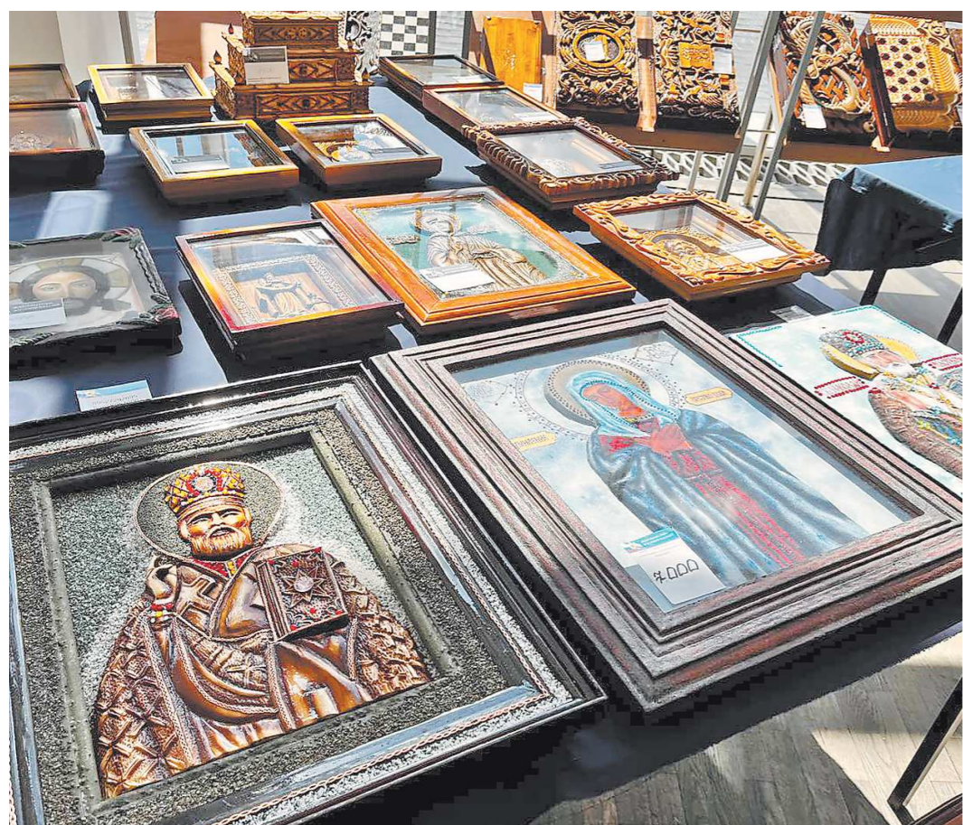
Осужденные в краснотурьинской ИК-3 создают иконы