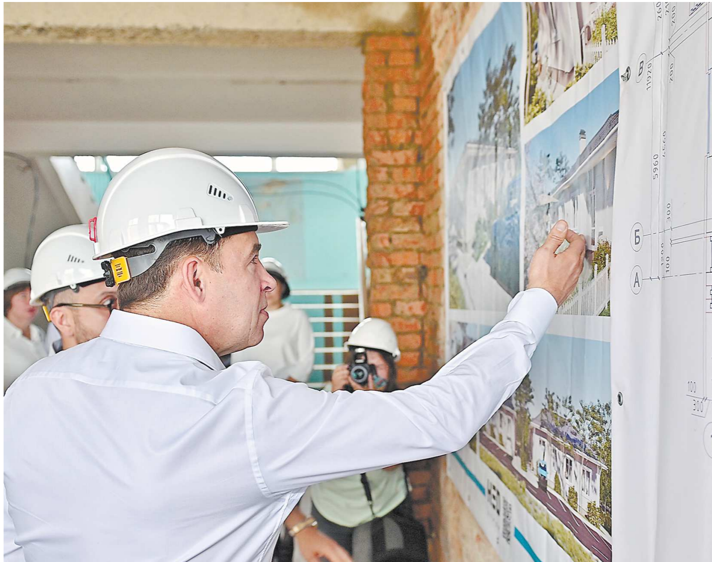
В Волчанске губернатор ознакомился с ходом ремонта детского сада и школы

По мнению главы региона, на данный момент необходимо помочь северным предприятиям влиться в работу по импортозамещению и наладить производство без иностранных партнеров. К 2025 году представители бизнеса на севере области планируют реализовать свыше 70 проектов с объемом инвестиций в 25 млрд рублей. Для привлечения медицинских кадров в отдаленные районы губернатор поручил региональному минздраву активнее привлекать спе-