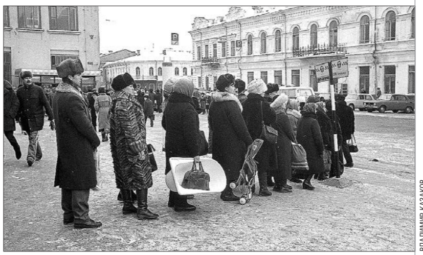
1987 год. Улица Вайнера, очередь к маршрутному такси