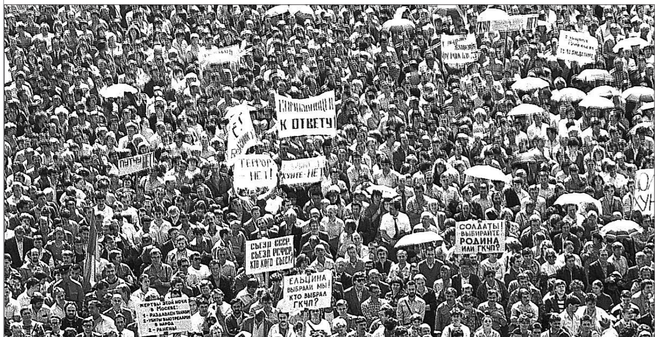
21 августа 1991 года. Митинг против ГКЧП на площади 1905 года