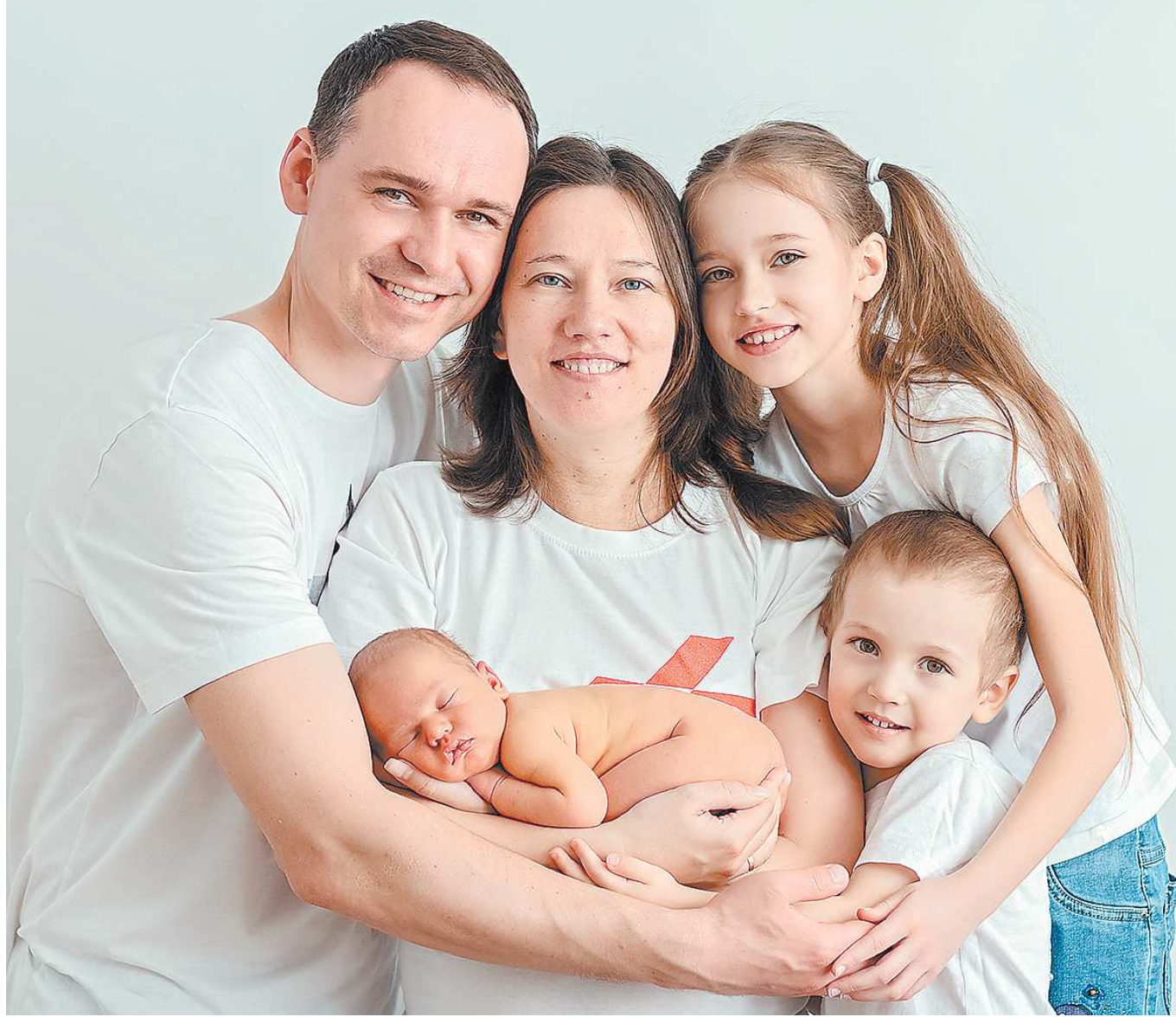
В Свердловской области размер регионального материнского капитала в 2022 году составляет 152 310 рублей за рождение третьего ребенка

Еще когда ребенок родился, я очень хотела купить