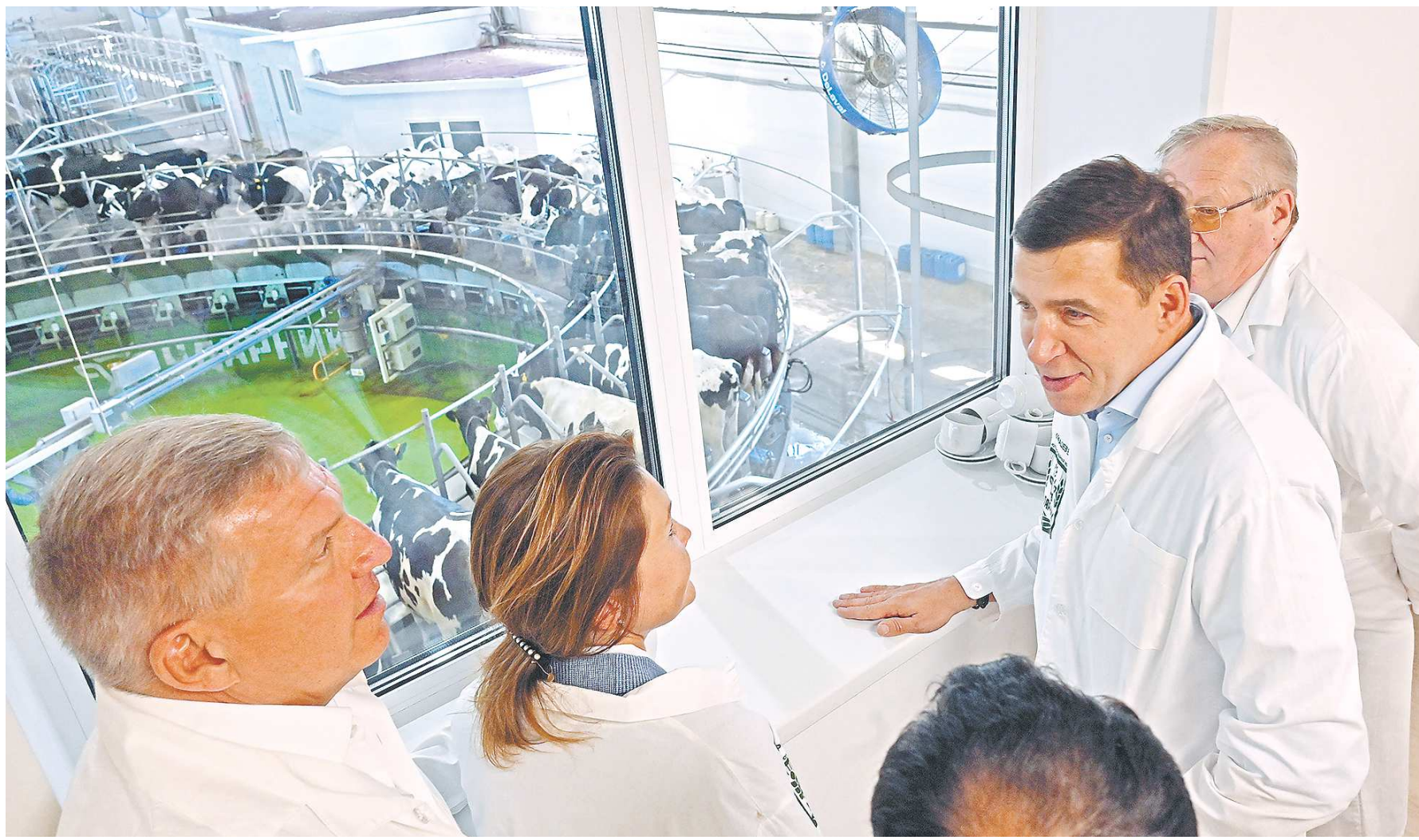
Губернатору рассказали, что специалистов на молочно-товарную ферму «Ударник» привлекают современные условия труда и достойная зарплата

По словам губернатора, от кадров напрямую зависят темпы развития сельского хозяйства, поэтому необходимо повышать престиж профессии, активнее продвигать аграрные специальности и привлекать абитуриентов. В связи с этим будет рассмотрен вопрос о привлечении аграриев в сельскую местность с помощью дополнительных выплат. Аналогичная практика уже используется в программах для медиков – «Земский доктор» и «Земский фельдшер». Традиционно Урал считают промышленным краем. Но мне кажется, пришло время сломать этот стереотип и сделать сельское хозяйство новой точкой роста нашей области. Более того, задача президента России дает нам такую возможность. Последние десять лет мы стремимся к тому, чтобы полностью обеспечивать себя продуктами питания,