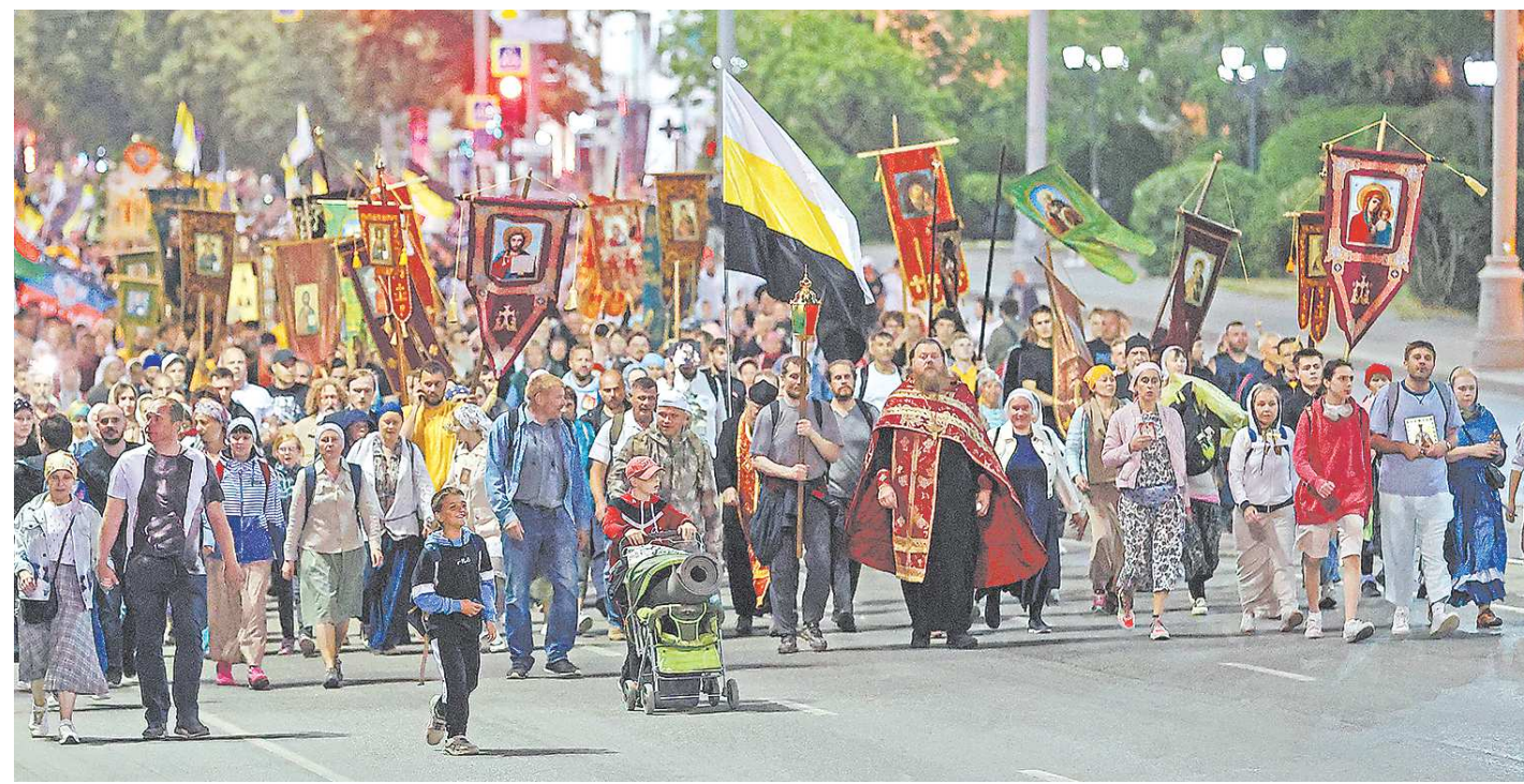
В молитвенном шествии приняли участие множество иностранных гостей из США, Германии, Сербии, Украины, Молдавии, Узбекистана и других стран