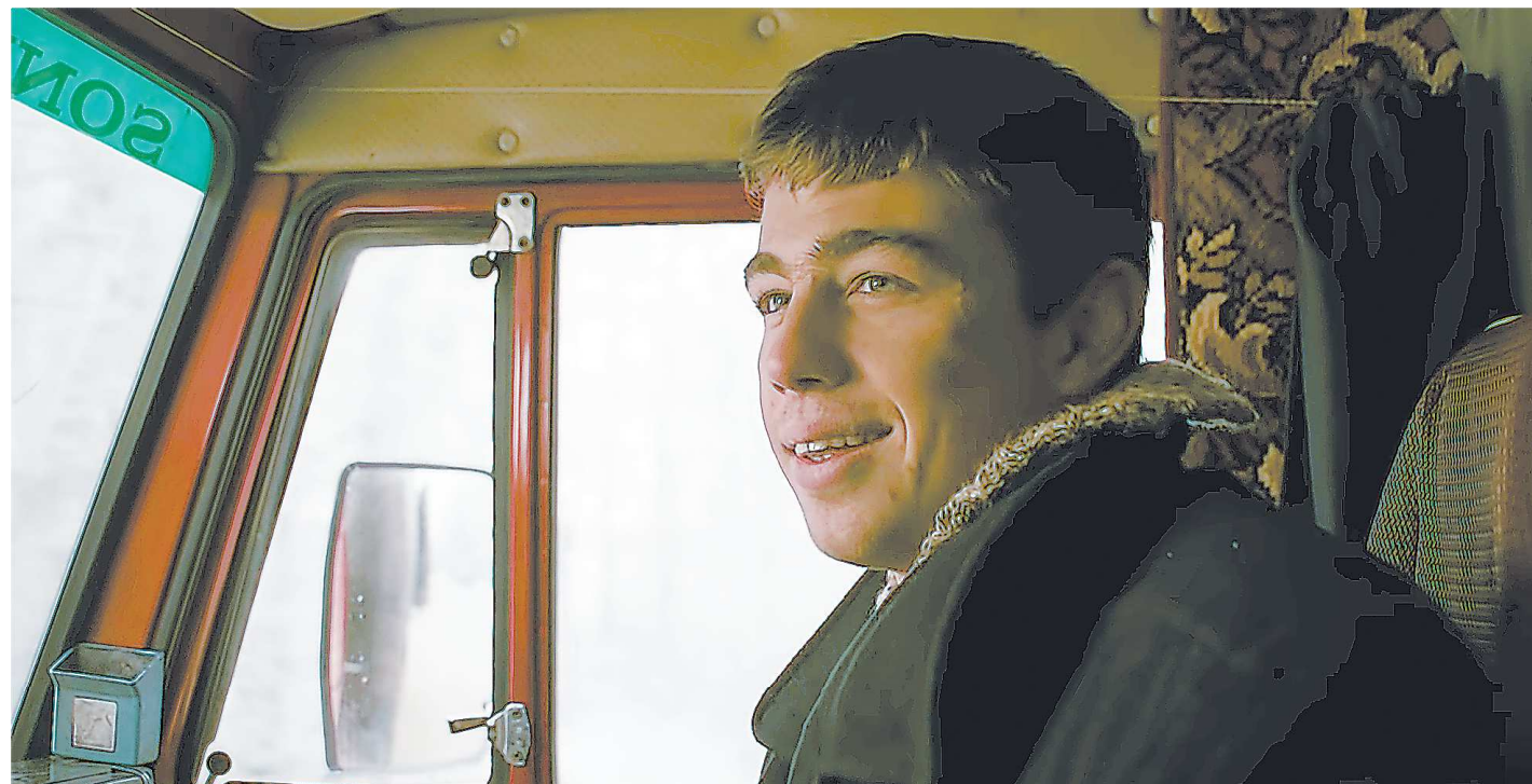
Бюджет «Брата» в 1997 году составлял около 10 тысяч долларов США. В повторном прокате фильм только за первую неделю собрал в десять раз больше

24 марта компания «Наше кино» планировала выпустить в прокат «золотую коллекцию» фильмов компании СТВ. Среди них – картины Свердловской области Алексея Балабанова «Брат» и «Брат 2». Даже продюсер этих культовых фильмов – Сергей Сельянов – сомневался в успехе по-