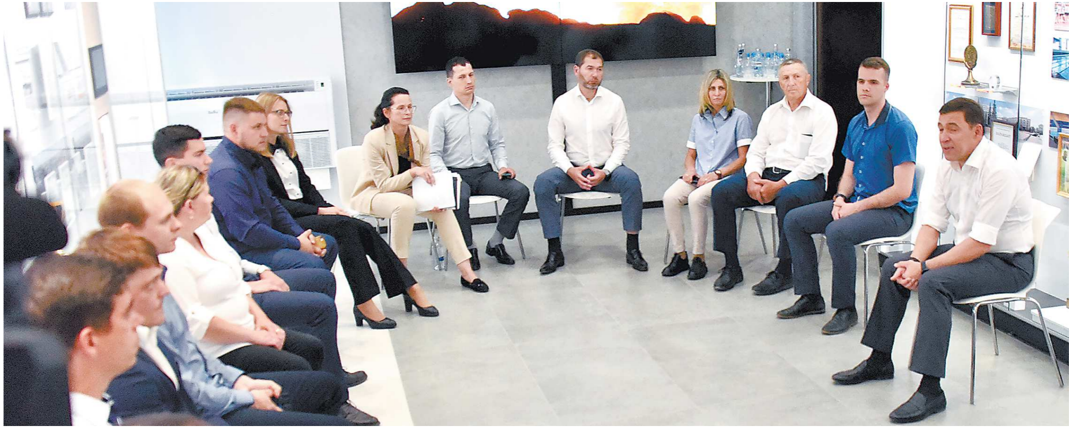
Участие во встрече с губернатором Евгением Куйвашевым (справа) приняли 15 молодых металлургов, которые смогли задать волнующие их вопросы

– Должна быть достойная зарплата, охрана труда, корпоративная работа. Но самое важное – то, как создается качество жизни вокруг человека. Получение достойного образования, благоустроенные парки, скверы и дворы. Отремонтированные дороги, каче-