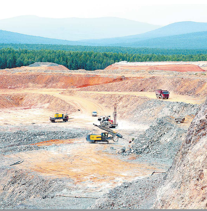
При производстве горных работ на Саумском месторождении используется современная техника и оборудование, позволяющие минимизировать воздействие на природу

И сейчас здесь строго контролируют все параметры воды – до поступления в очистные