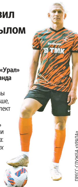
Так выглядит домашняя форма «Урала» на новый сезон