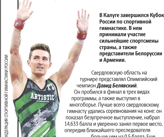
ФЕДЕРАЦИЯ СПОРТИВНОЙ ГИМНАСТИКИ РОССИИ

В Калуге завершился Кубок России по спортивной гимнастике. В нем принимали участие сильнейшие спортсмены страны, а также представители Белоруссии и Армении.