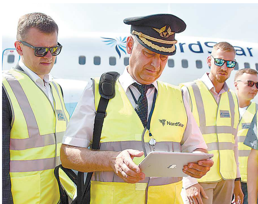
Оплата заправки происходит в онлайн-режиме с помощью приложений на планшетах пилота и оператора топливозаправщика

Оплата заправки самолетов в «Кольцово» проходит в режиме онлайн