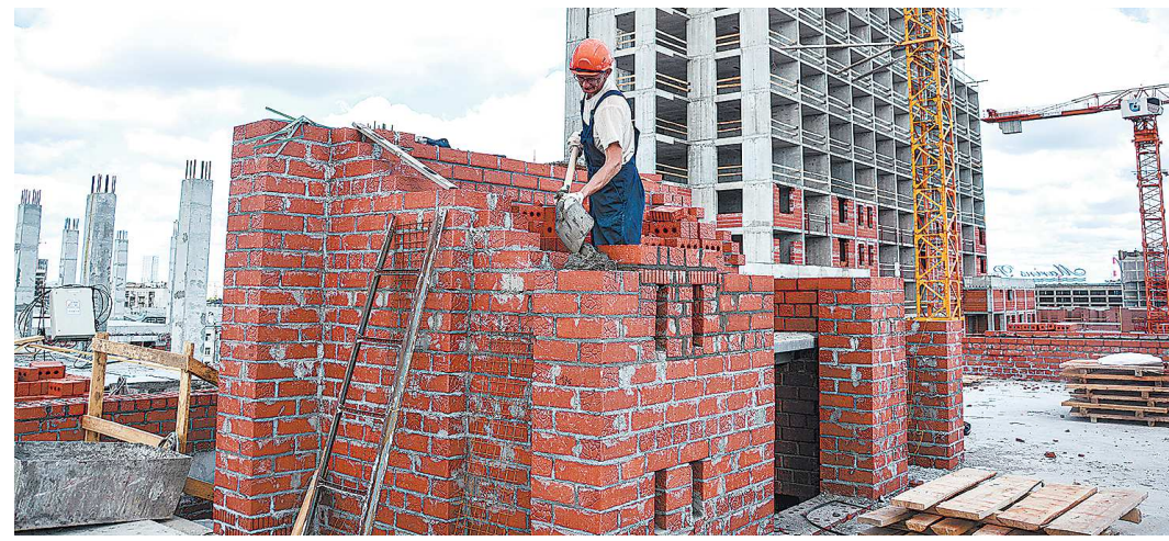
Кампус УрФУ планируют ввести в эксплуатацию в 2026 году

Вместе с тем, по словам главы региона, для формирования полноценного студенческого городка необходимо строительство дополнительных объектов. Среди них – корпус института экономики и управления, института радиотехники и информаци-