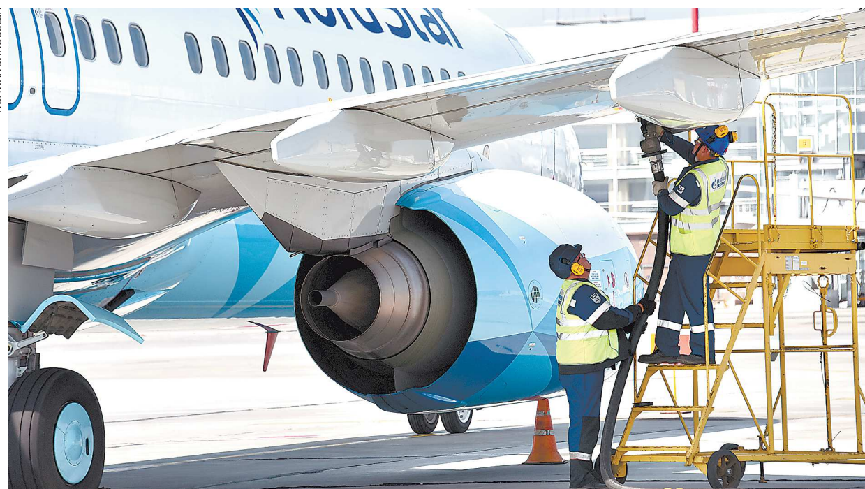
С новой цифровой площадкой самолет заправляют быстрее на пять минут

В «Кольцово» презентовали отечественную блокчейн-платформу Smart Fuel для моментальной оплаты авиазаправки. Теперь весь процесс вместо 5 дней занимает всего 15 секунд. Новая технология, считают ее разработчики, минимизирует задержки рейсов и позволит снизить цены на билеты.