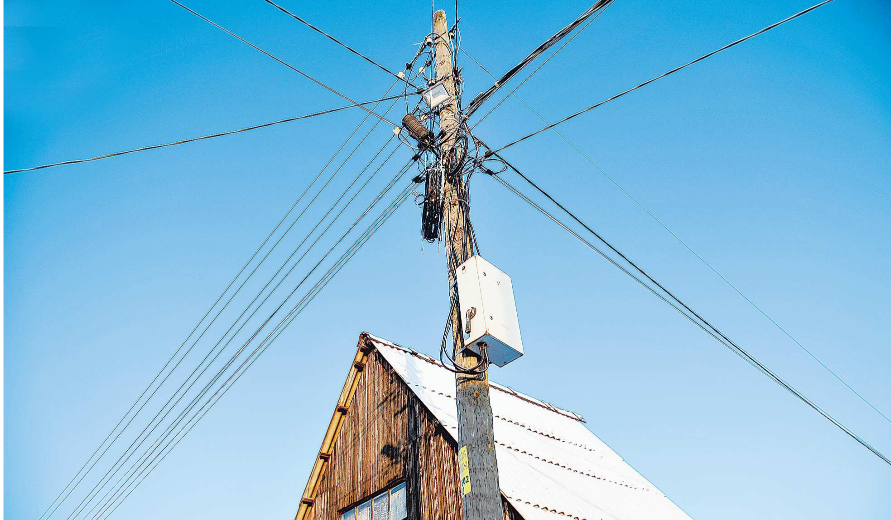
Ветхие деревянные столбы с путаницей проводов, установленные к тому же вплотную к домам, – типичная картина во многих садоводческих товариществах