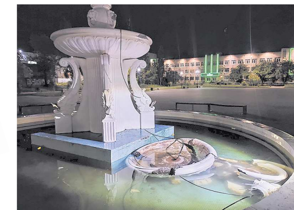
Кроме чая, вандалы повредили металлические конструкции и трубы для подачи воды

В центре Асбеста разгромили фонтан за 1,6 миллиона рублей. Как сообщила газета «Асбестовский рабочий», компания молодых хулиганов под покровом ночи забралась в фонтан на Форумной площади – инцидент запечатлели камеры видеонаблюдения.