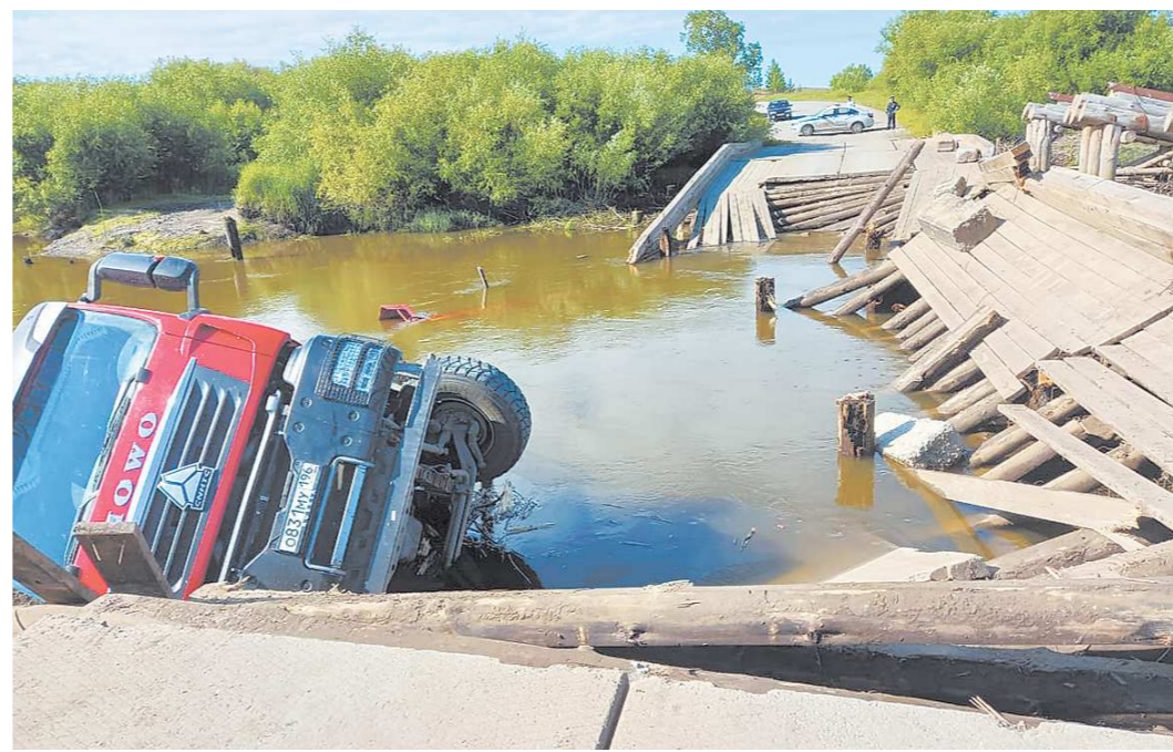
По предварительным данным, вес самосвала вдвое превышал максимально разрешенный для переезда по мосту