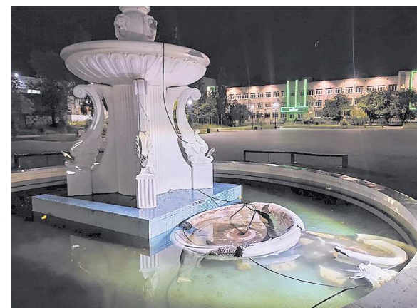
Кроме чая, вандалы повредили металлические конструкции и трубы для подачи воды

В центре Асбеста разгромили фонтан за 1,6 миллиона рублей. Как сообщила газета «Асбестовский рабочий», компания молодых хулиганов под покровом ночи забралась в фонтан на Форумной площади – инцидент запечатлели камеры видеонаблюдения.