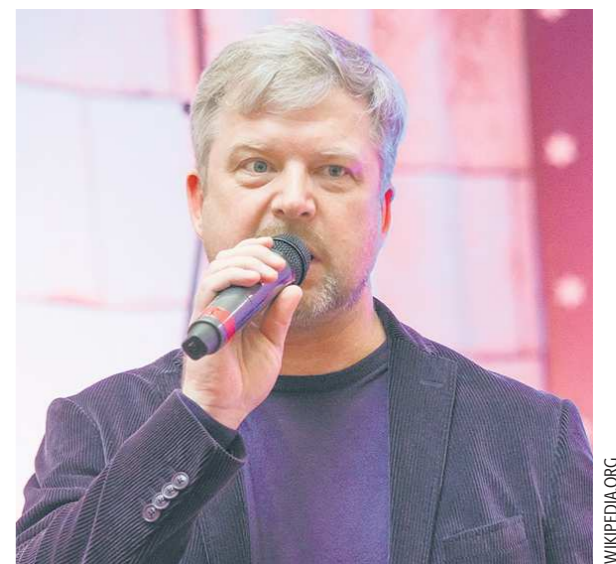
Вчера стало известно, что Александр Масляков не приедет в столицу Урала, поэтому Валдис Пельш проведет эту игру вместо него.

Им предстоит сыграть в конкурсах: «Приветствие», «Разминка», «СТЭМ» и «Музыкальное домашнее задание». Организаторы уже объявили, что оценивать выступления участников должны были в том числе актер, продюсер, капитан легендарной команды «Уральские пельмени» Андрей Рожков и телеведущий Валдис Пельш.