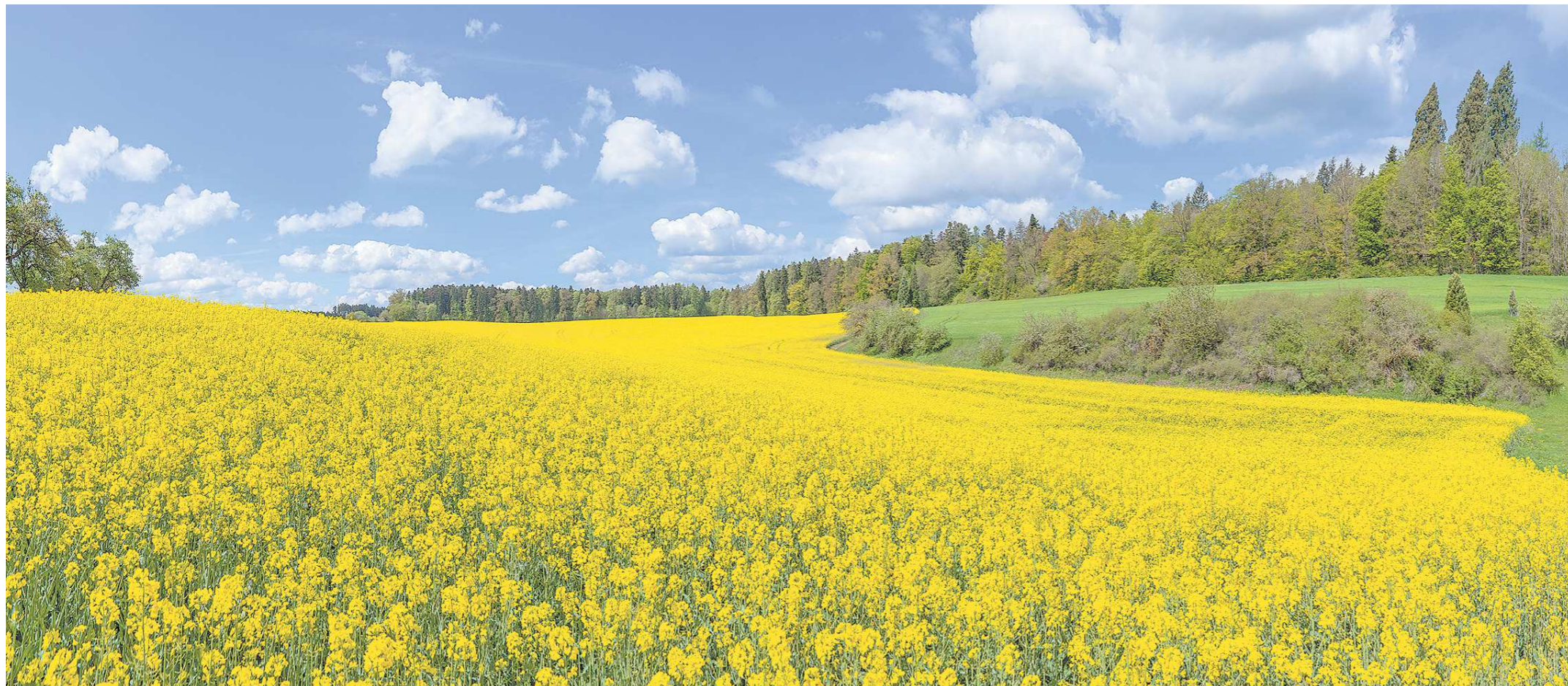
Раньше рапс выращивали на корм животным, сейчас зерно идет на производство биотоплива и рапсового масла