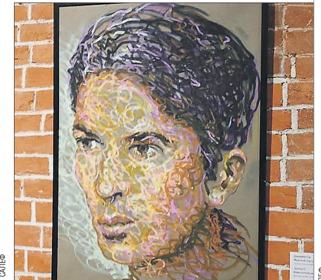
«Мужской портрет. Набросок». Автор: Джими Си

чечной живописи, развивая тему городского пейзажа. Не обошлось в новом сезоне и без меццо-тинто – столь любимой графической техники на Урале. В «Главном проспекте» представили гравюры мастера из Японии Кацунори Хаманиси. В технике меццо-тинто изображение создается не линиями и штрихами, как в офорте, а плавными тональными переходами, по-другому это искусство называют ещё «чёрной манерой». Японский художник