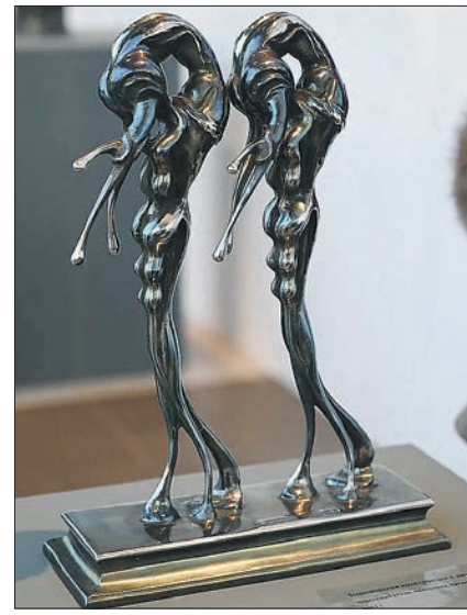
«Биомиметическая конструкция с двумя производными». Автор: Алексей Залазаев