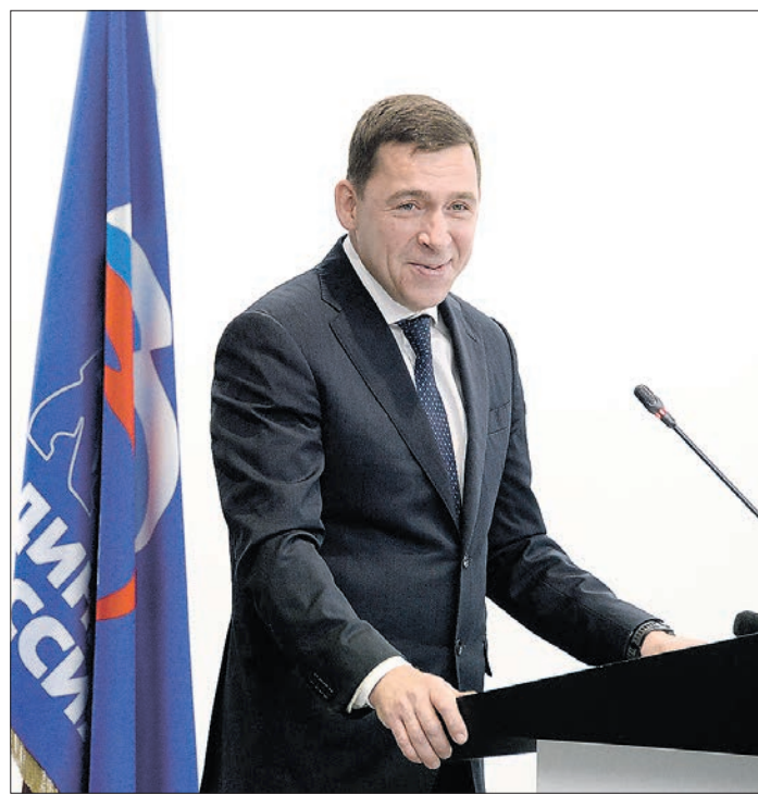
Евгений Куйвашев избран секретарём свердловского регионального отделения партии «Единая Россия»

Председатель Заксобрания Свердловской области и член президиума региональ-