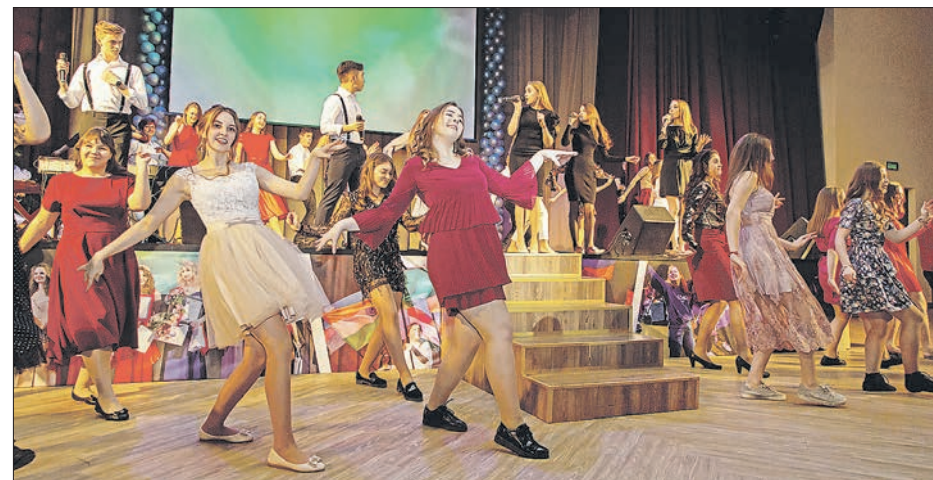
Зимний бал – праздник, которого ждут многие студенты УрГЭУ