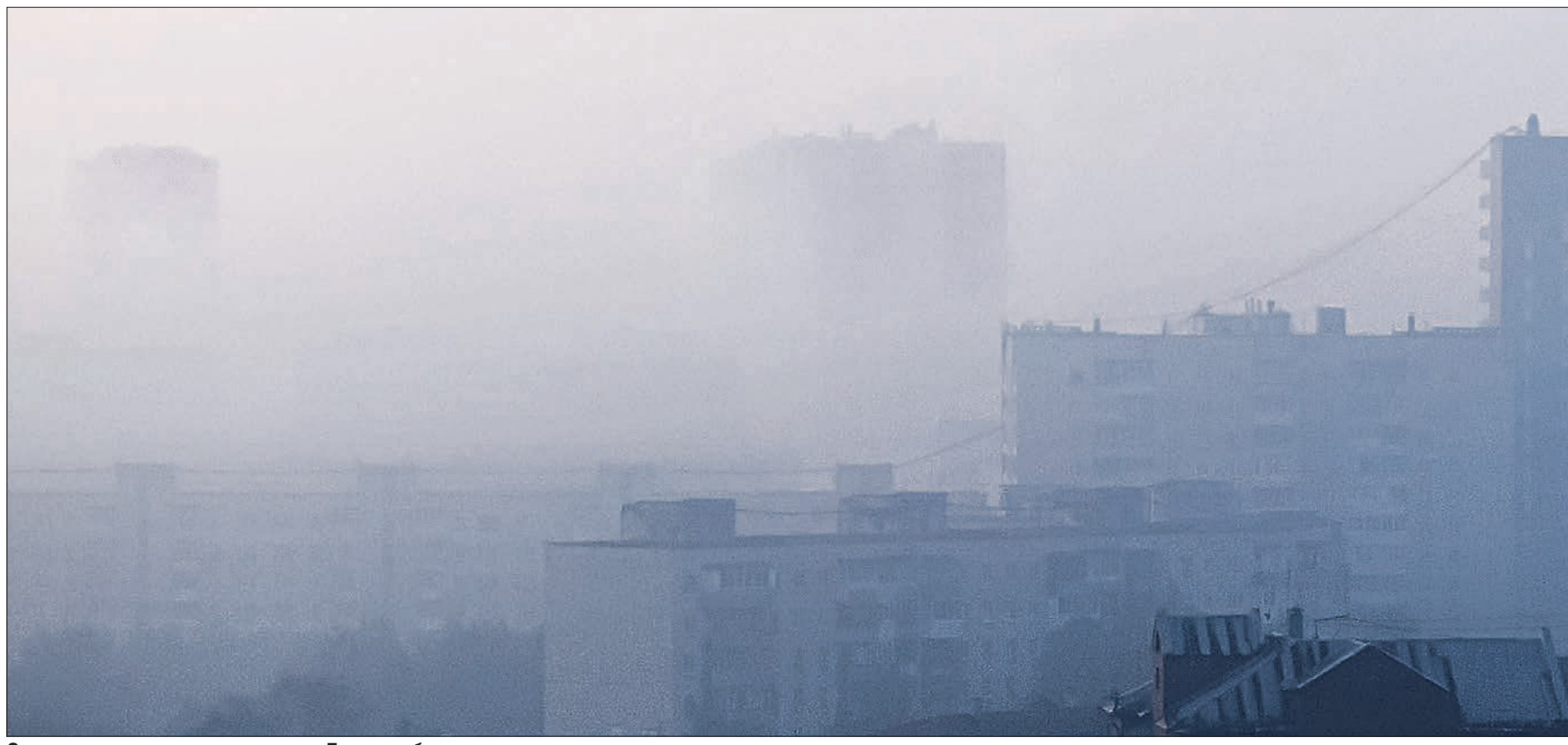
Смог «съел» многоэтажные дома Екатеринбурга

В выходные экоактивисты обнаружили под Екатеринбургом четыре очага торфяных пожаров. Находятся