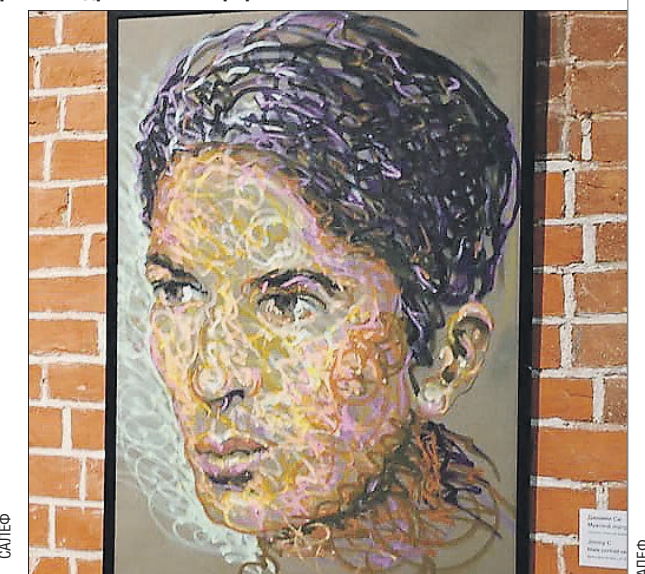
«Мужской портрет. Набросок». Автор: Джими Си

чечной живописи, развивая тему городского пейзажа.