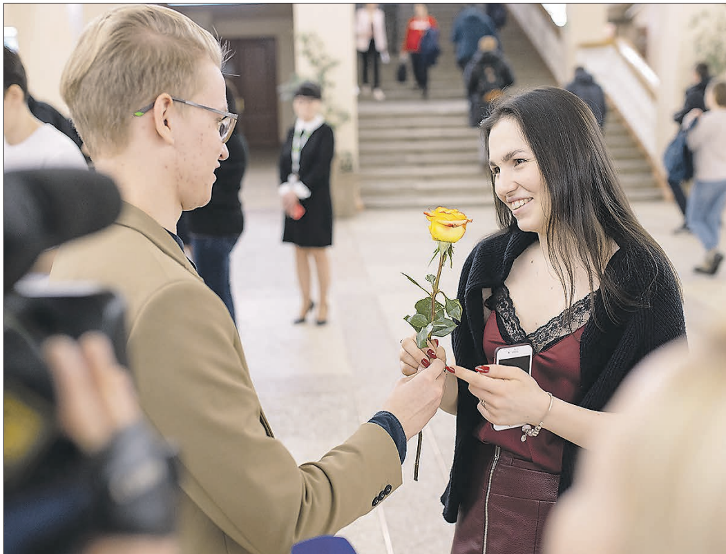
Всем Татьянам в УрФУ в День студента дарят цветы