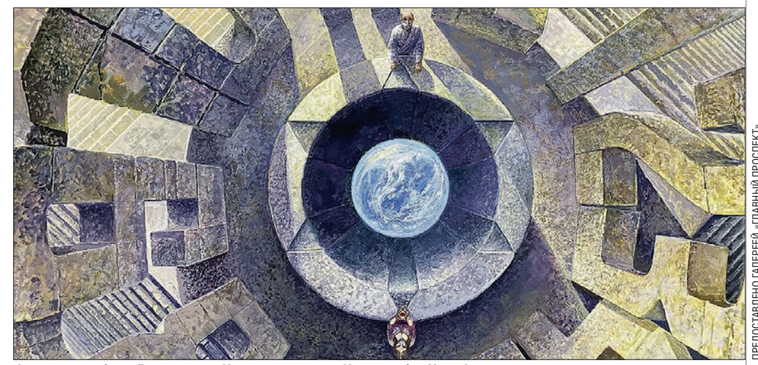
Фрагмент работы Владислава Ковалья из серии «Квадромбы. Ноосфера»

В соседнем зале расположены произведения британского стрит-арта художника Джеймса Кокрана, известного под псевдонимом Джими Си. Именно он в декабре 2021 года подарил Екатеринбург портрет «Ливерпульской четвёрки» рядом с памятником The Beatles. Автор предпочитает творить в стиле «капельного рисунка» – аэрозольной то-