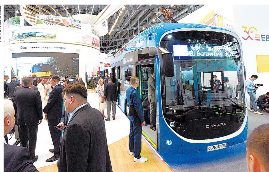
Электробус «Синара-6253» – в числе самых посещаемых точек на ИННОПРОМе. Сертификация электробуса должна завершиться к середине следующего года. Планируется, что машины будут изготавливать в Челябинске.