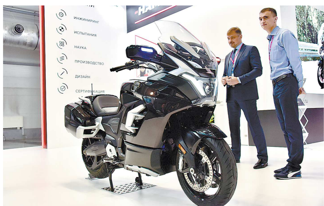
Электромоторчик Merlon разработан Центральным научно-исследовательским автомобильным и автомоторным институтом – «НАМИ». Серийное производство таких мотоциклов планируют запустить в 2024 году