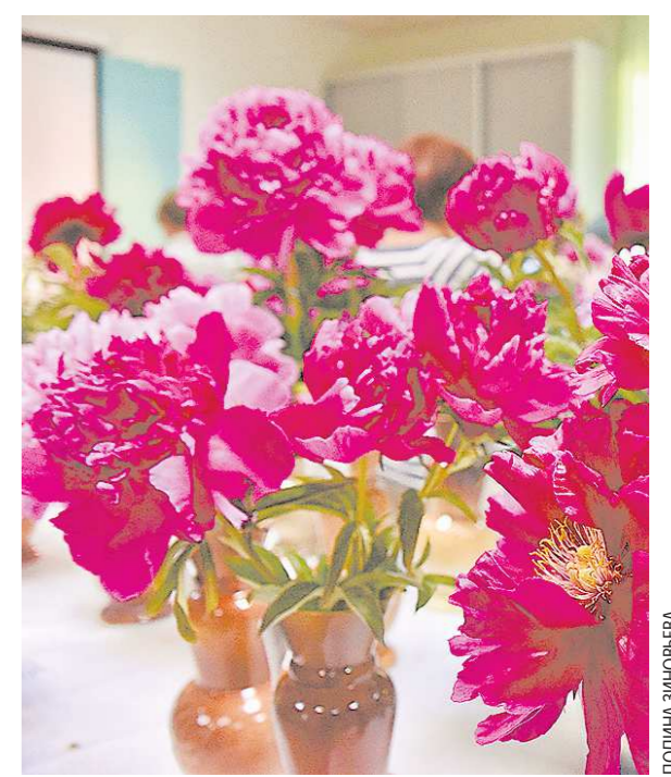
В Китае пионы являются символами скромности и застенчивости