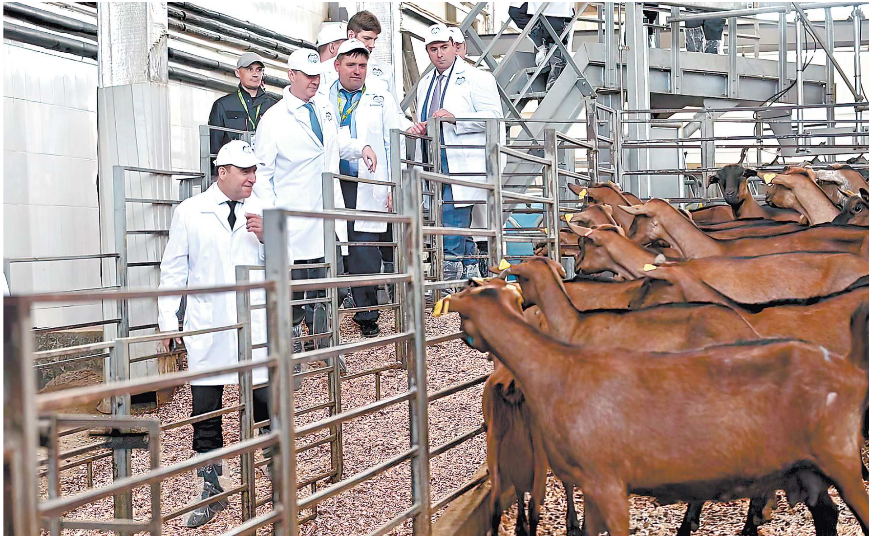
Дмитрий Патрушев посетил первую козоводческую ферму на Урале, оборудованную современными линиями приготовления и раздачи кормов

Дмитрий Патрушев сообщил, что в целом по стране темпы уборки зерновых и овощей в этом году выше прошлогодних. Говоря о развитии животноводства, глава федерального Минсельхоза отметил, что в Свердловской области рост по производству скота, птицы и молока. Регион занимает первое место в Уральском федеральном округе по производству яиц и молочному животноводству.