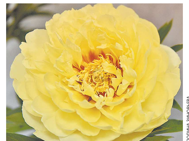
Барцелла – гибрид, основанный на скрещивании травянистого и древовидного пиона