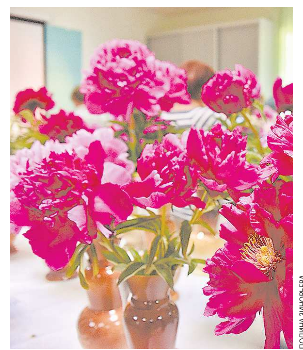
В Китае пионы являются символами скромности и застенчивости