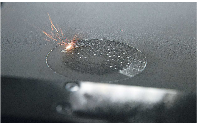
Процесс наращивания металлического порошка

ЦИФРЫ 500 человек принято за последние три года в «Центротех»