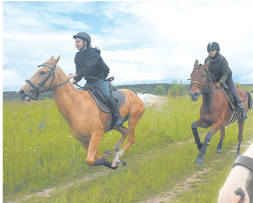
Специально для журналистов Харли Квин (слева) и Тальянка (справа) показали, на что они способны