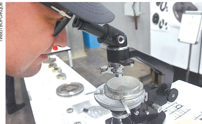
Ячейки в напечатанной детали можно разглядеть лишь в микроскоп