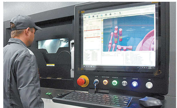
3D-принтер трудится, лишь изредка требуя помощи человека

Гендиректор «Центротеха» подчеркнул, что интерес и желание работать на производстве у молодежи появляется, когда они не просто побывают на предприятии, а начиная с третьего курса поработают с наставником.