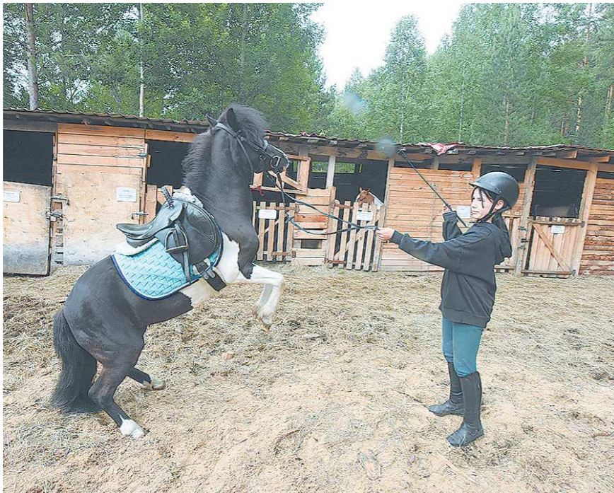
В конном клубе Березита готовят к скачкам не только лошадей, но и пони