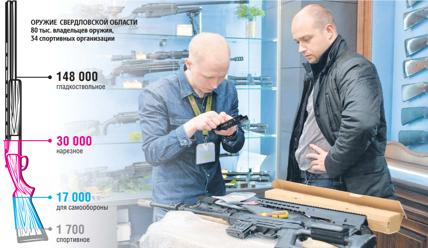
ОРУЖИЕ СВЕРДЛОВСКОЙ ОБЛАСТИ 80 тыс. владельцев оружия, 34 спортивных организации

В Законе «Об оружии» появились новые категории граждан, которым мы откажем в выдаче лицензии. Это касается в первую очередь осужденных за преступления террористического характера или экстремистской направленности, а также за преступления, совер-